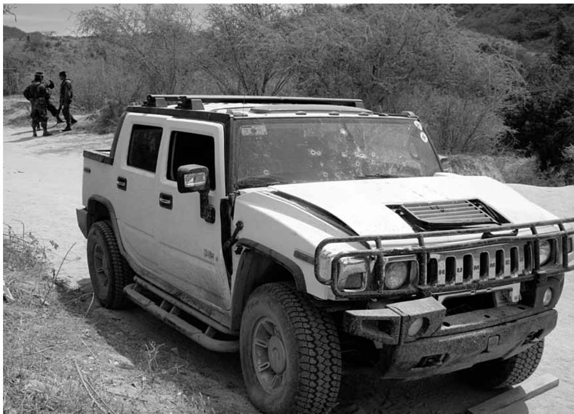
Juan Carlos Cruz

Durante mi investigación en torno a las violencias vinculadas al narcotráfico y de manera especial respecto de su relación con los universos juveniles en el país, tanto a partir de los pocos datos duros que circulan de manera oficial como por medio de mi