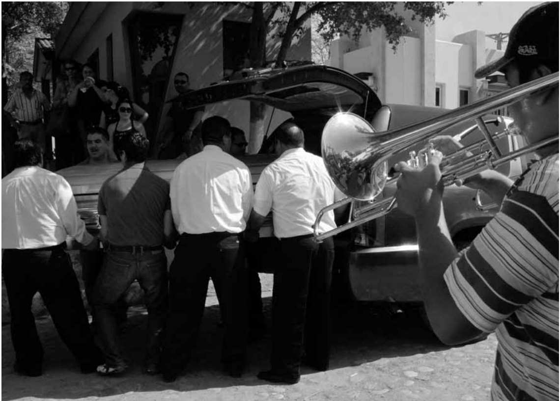
La música de banda sinaloense es utilizada por narcotraficantes tanto para celebrar como para despedir a los caídos en la “narcoguerra”, 2010.

En este contexto, es difícil afirmar que las violencias desatadas por el “narcopoder” y el crimen organizado puedan ser inscritas en el afuera de la ilegalidad. Este análisis me parece simplista e insuficiente. Por ello propongo abrir un tercer espacio analítico: la paralegalidad, que emerge justo en la zona fronteriza abierta por las violencias, generando no un orden ilegal, sino un orden paralelo con sus propios códigos, normas y rituales que al ignorar olímpicamente las instituciones y el contrato social se constituye paradójicamente en un desafío mayor que la ilegalidad. Para ratificar el poder paralelo de la “narcomáquina” encuentro dos analizadores clave: a) El