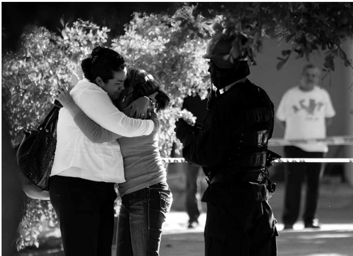
Dos mujeres lloran después de enterarse del asesinato de un familiar en la colonia Infonavit Humaya, en Culiacán, Sinaloa, 2011.

complejo, peligroso, vertiginoso que puede hacerse desde los territorios de la academia. 10