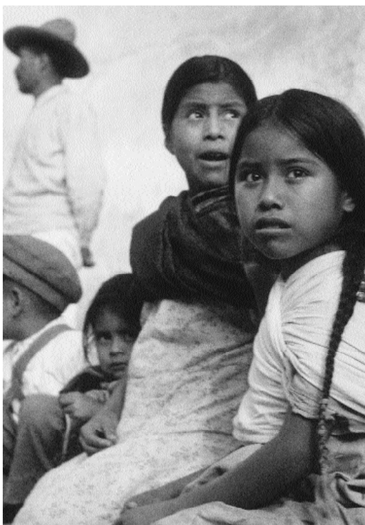
Detalle de la fotografía de Julio de la Fuente.

de que el progreso y la modernidad implican ciertas premisas raciales. Pero el mestizaje también se ha convertido en el paradigma ideológico que posibilita la identificación de pueblo y elites con el Estado. Sólo por dar los ejemplos más conocidos, se puede decir que desde la Memoria sobre las causas que han originado la situación actual de la raza indígena y los medios para remediarla (1864) de Francisco Pimentel, pasando por el diagnóstico de Andrés Molina Enríquez en Los grandes problemas nacionales (1909), hasta la declaración de principios nacional-indigenistas de Manuel Gamio en Forjando Patria (1916), se ha concebido una relación causal entre el mestizaje de la población nativa con flujos seleccionados de inmigrantes de origen europeo y el proceso de modernización nacional. El aborigen americano debía ser transformado mediante la mezcla biológica, no había mejor y más rápido