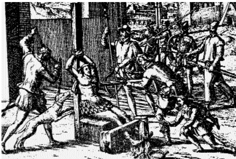
Transfixión de un cacique indio, previamente sometido al cepo y al vertido de metal fundente en los pies. Grabado en Johann Cloppenburg, Le miroir de la tyrannie espagnole perpetrée aux Indes Occidentales , Amsterdam, 1620

La realidad es que la cultura actual del pueblo latino-americano es una fusión de las que los españoles encontraron a su llegada y de la que