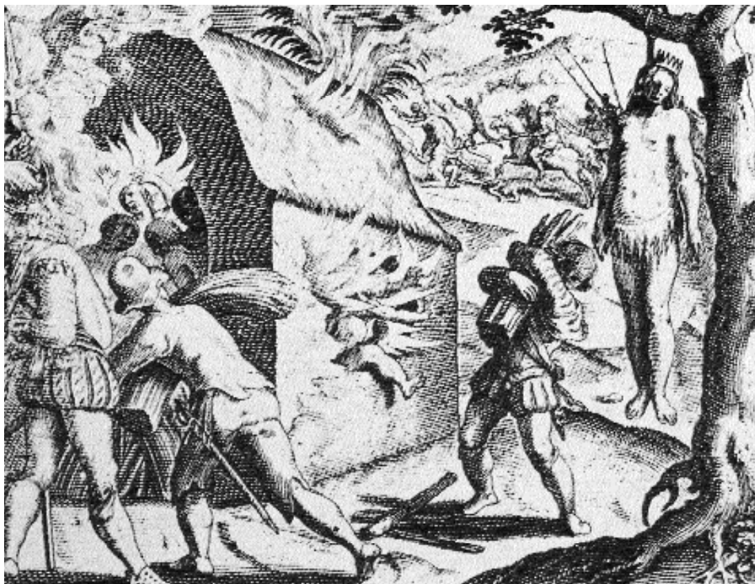
Los españoles enseñan el cristianismo a los indios. Grabado en Johann Cloppenburg, Le miroir de la tyrannie espagnole perpetrée aux Indes Occidentales , Amsterdam, 1620.

con las corrientes del antirracismo internacional y del indigenismo nacional-revolucionario, siempre buscando el vínculo con la lucha por la defensa de los derechos humanos. Todo ello le fue reconocido en vida. Honores recibió, premios hubo que se instituyeron en su nombre, como el Juan Comas Award establecido en 1969 a iniciativa de la Wenner-Gren Foundation y la American Association of Physical Anthropologist. Casi al final de su vida se le concedió en 1978 el Premio Malinowsky en reconocimiento a la importancia universal de sus trabajos en contra del racismo. 3 Como aconteció