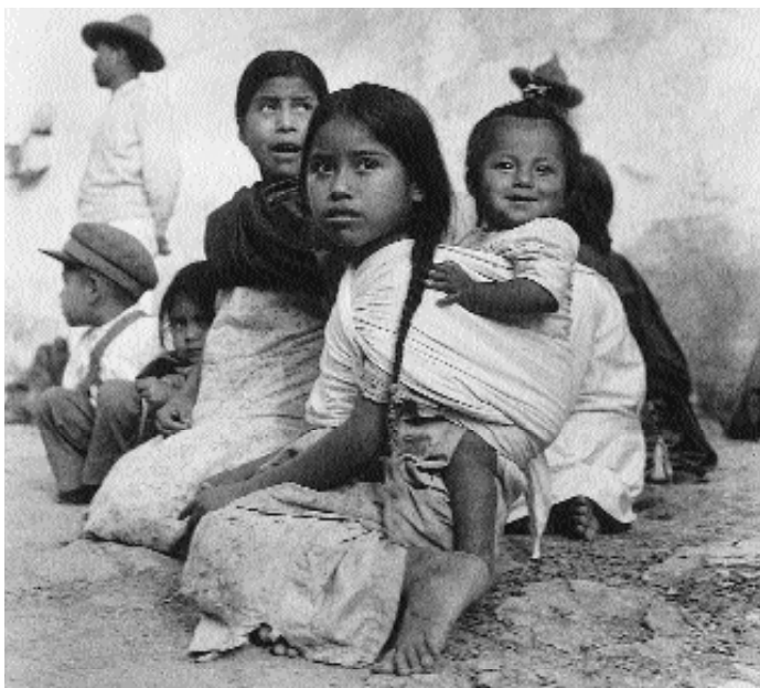
Foto tomada en Oaxaca por Julio de la Fuente, ca. 1950, Fototeca "Nacho López" del INI.

tratado como "hembra"). En ambos casos, se le identifica sexualmente con menores de la sociedad ladina, la mujer y el niño, cuyo status tiene una situación homóloga al suyo" ( op. cit. : 89-90).