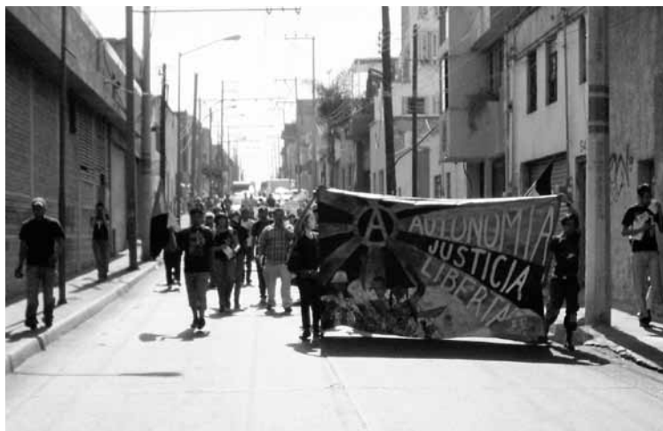
Marcha de la Red Mexicana de Trabajo Sexual, La Otra Campaña y el Colectivo anarcopunk Jalisco, 2007.