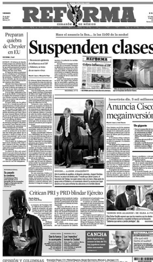
El Inicio de la emergencia, viernes 24 de abril

No obstante que trabajamos con un corpus acotado (81 primeras planas), la lectura y varias sucesivas relecturas del material nos plantearon muchas incógnitas, inquietudes, observaciones y conclusiones, que es imposible siquiera mencionar en esta primera exploración. Ante este mar de información nos planteamos una pregunta que guiará el análisis: ¿qué historia contó la prensa y cómo se vinculó con el contexto público de esos días? A fin de cuentas, las noticias son una historia, una historia que