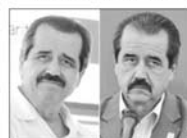
CANABOCA A LA VISTA. El presidente en un momento de su discurso ante el Congreso.