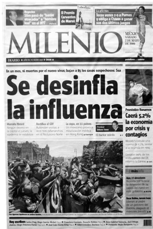
El anuncio de la contención de la enfermedad, sábado 2 de mayo

Los caminos se dividen y cada quien toma el suyo. Ese día cada diario contó su propia historia excepto Milenio y La Crónica , que se ocuparon de notificar a sus lectores el inicio de la contención de la enfermedad: “Se desinfla