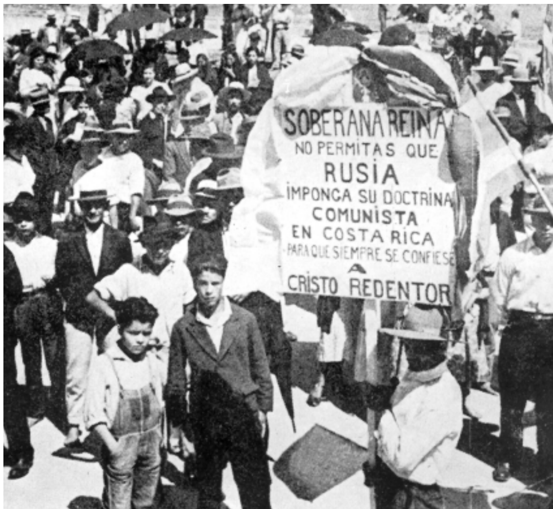
Tricentenario de la aparición de la Virgen de los Ángeles en 1935, una conmemoración fuertemente anticomunista (Borge, 1941: 576-577).

El énfasis en la asistencia a las urnas no era casual: un factor crucial en el éxito comunista de 1934 fue el elevado abstencionismo. La ley electoral de 1927 establecía que cuando había uno o dos escaños en disputa, la votación se definiría por mayoría relativa (ganaba el partido con más sufragios); pero si eran tres o más los asientos, se aplicaría el método proporcional, que consistía en dividir el total de votos entre las plazas en juego para obtener un cociente que sería utilizado para la adjudicación (Molina Jiménez, 2004b: 199-202). La escasa participa-