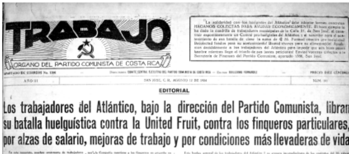
Trabajo informa sobre el inicio de la huelga bananera, el 12 de agosto de 1934.

por cooperar para generar más trabajo contribuye a una mayor prosperidad de la nación y a la seguridad de sus propias posesiones. Pero los capitalistas no lo ven de esa manera y siguen un curso peligroso (USNADF 818.00B/38, 1-VI-1932: 1-2).