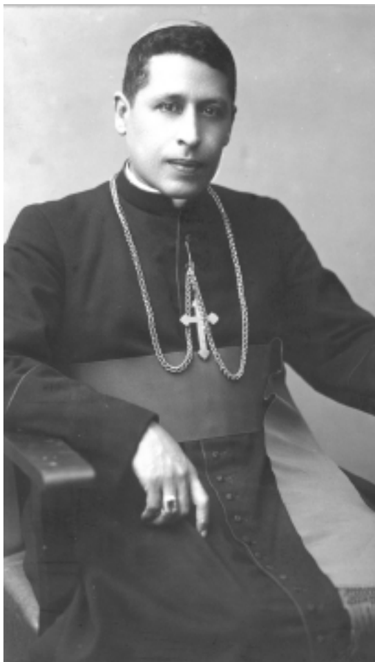
Víctor Manuel Sanabria, el prelado costarricense más comprometido con la reforma social; cerca de 1940.

El contenido de los textos precedentes evidencia cómo el discurso eclesial y el de los comunistas poco a poco, empezaron a converger, proceso facilitado por el giro “izquierdista” que experimentó el enfoque clerical y porque el BOC, a medida que consolidaba su inserción política, abandonaba su “ultraizquierdismo” inicial y, a tono con el cambio experimentado por el Comintern a partir de 1935 (Caballero, 1986: 122-123; Fornet-Betancourt, 2001: 172-173), asumía una estrategia de tipo frente popular (Cerdas, 1986: 307-344; Merino del Río, 1996: 27-69). La confluencia en el centro fue viable por la existencia de un