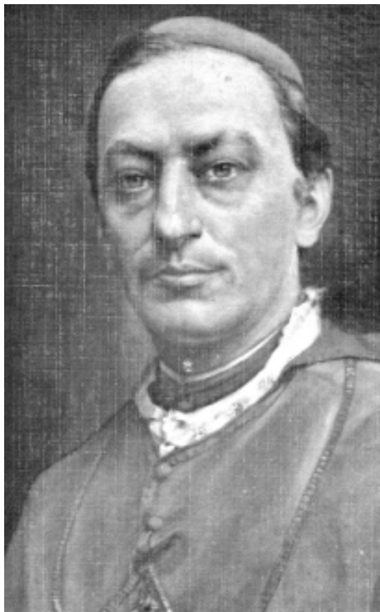
Bernardo A. Thiel (detalle, óleo sobre tela, de Enrique Echandi, 1903 (Colección Curia Metropolitana).

La desatención de las demandas populares, sin embargo, obedeció ante todo a que, tras el fallecimiento de Thiel en 1901 y la apertura democrática que el país experimentó después de finalizar el periodo autoritario de Rafael Iglesias (1894-1902) (Molina Jiménez, 2001a: 41-57), la jerarquía eclesiástica se esforzó por conseguir el suficiente apoyo en el Congreso para derogar la legislación anticlerical, tarea en la que contaron con el respaldo de un círculo de diputados devotos, liderados por el doctor Rafael Calderón Muñoz (Soto, 1985: 118-123 y 130-136). El catolicismo político, a tono con el viejo programa de la Unión Católica, prevaleció sobre el social.