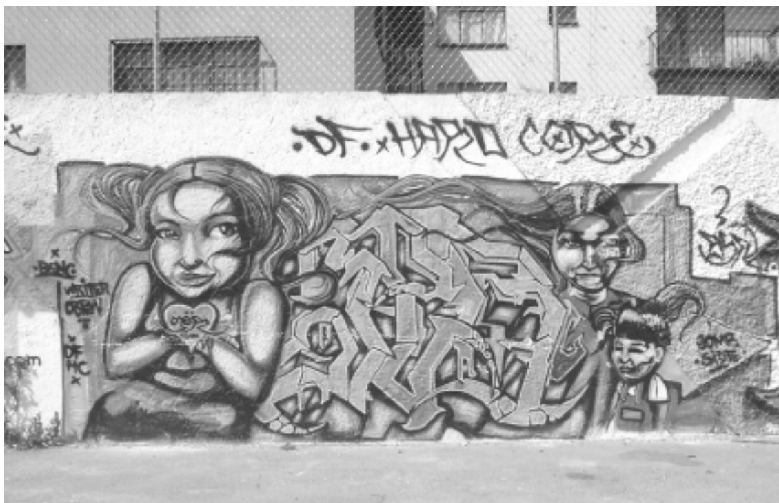
México, D.F.

de nuevos discursos (ambientalismo, conservacionismo)? Estos capítulos aportan una visión compleja y matizada del regionalismo en Yucatán, en especial de su capacidad de reconversión y de adaptación a la globalización y a los cambios políticos y económicos nacionales de los cuales se nutre. No es un regionalismo “comunitario” ni “cultural”, sino un dispositivo activado por actores económicos, políticos o culturales insertos en la globalidad de su región, de su nación y de su mundo en general.