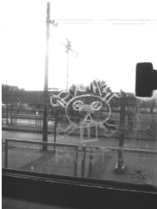
Scratch en un transporte colectivo