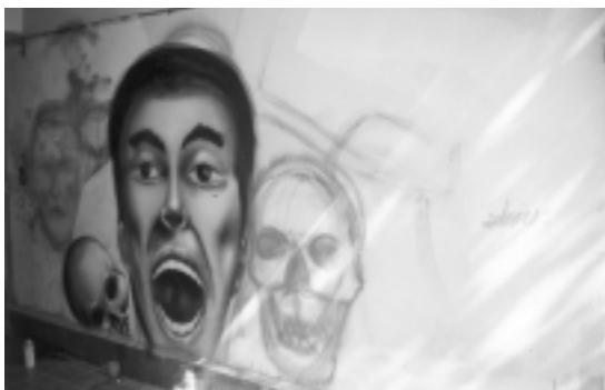
El Docil realiza un mural

aquí en el Distrito, pero yo creo que para mí la leyenda más más pesada yo creo que viene de Guadalajara, con ese güey que pintaba Duran. De hecho, cuando él llegaba aquí a México todos las crews que estaban aquí se hincaban, hacía puras tags .