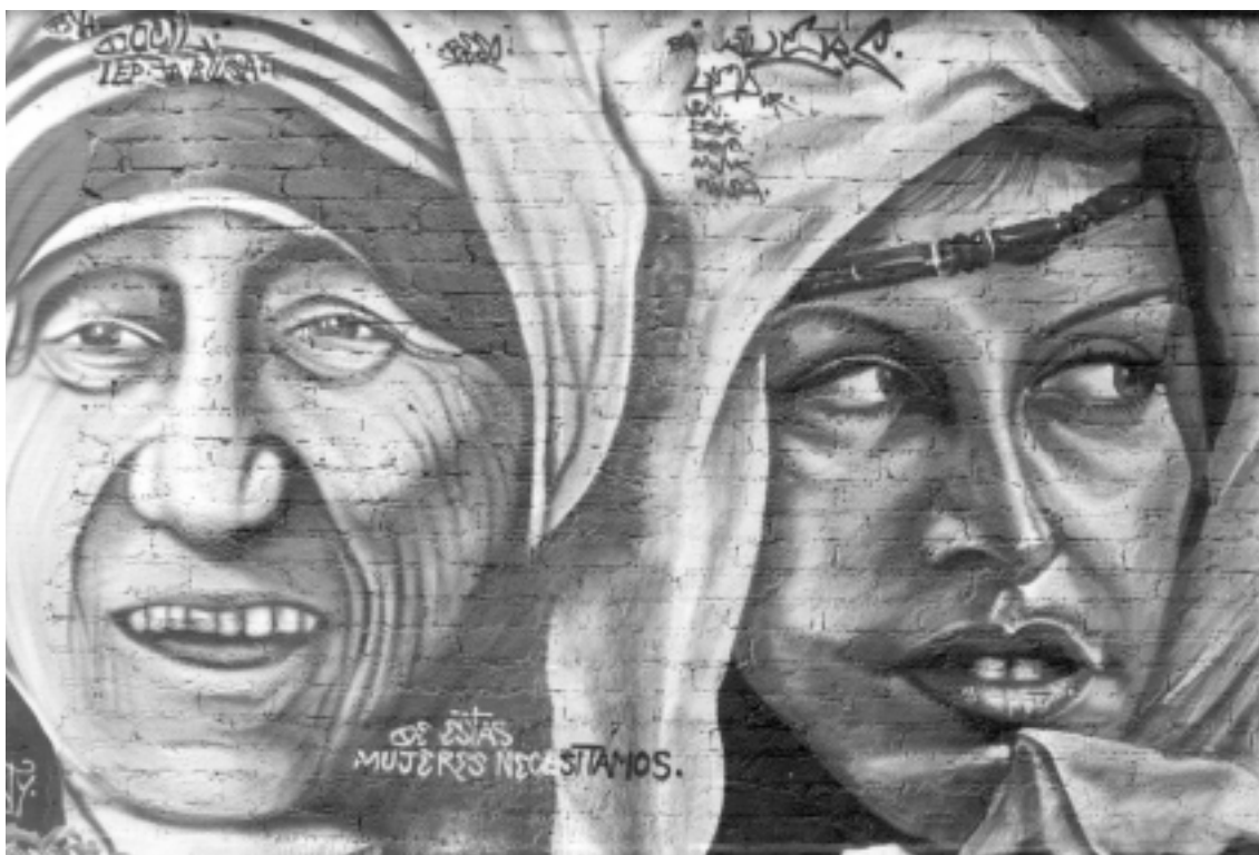
Av. Aztecas, Coyoacán

Mira, éramos unos chavos muy reprimidos y fuimos parte del movimiento punk y el dark , yo fui punk , fui hard-core , toqué en bandas y nuestra onda empezó como hace aproximadamente ocho años. Empezó el Koka y su primo, que en ese tiempo ponía Balam y Rat, ellos dos eran los que formaban el crew LEP. Después, como a los