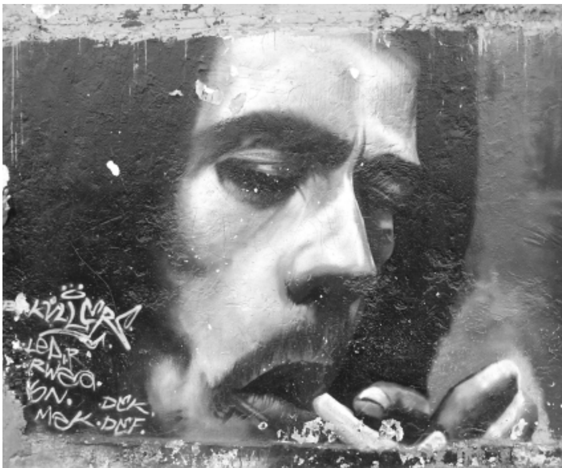
Av. Aztecas, Coyoacán

Por eso lo que yo hago con el graffiti es aprender técnicas de colores transparentes sobre opacos en contraste. Eso sirve mucho como para crear cosas también. A mí me ha hecho mucho el paro la aerografía pues gracias a ella yo he avanzado. Pero te puedo decir que para mí el