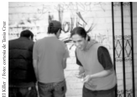
El Killer / Foto: cortesía de Tania Cruz