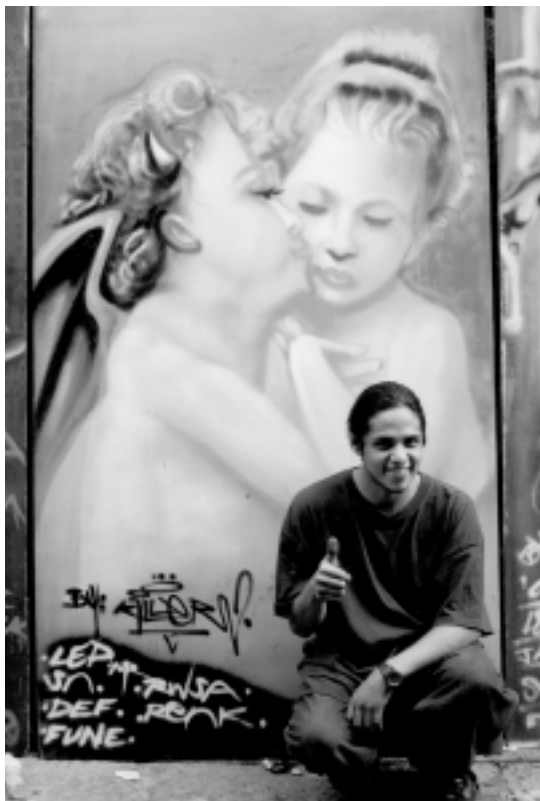
El Killer

¿En ese tiempo? Bueno, pues había fallecido una hermana, la atropellaron, tuvo un accidente, de ahí como que se vino abajo mi casa, porque mi mamá sí andaba medio sacadona de onda. Se divorció de mi jefe, bueno, se separaron un buen rato, ya de ahí fue cuando falleció mi mamá. Yo tenía poco que me había juntado y pues yo me