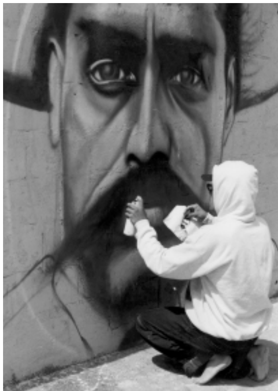
El Dócil pintando