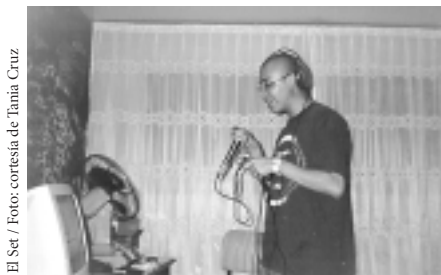
El Set / Foto: cortesía de Tania Cruz