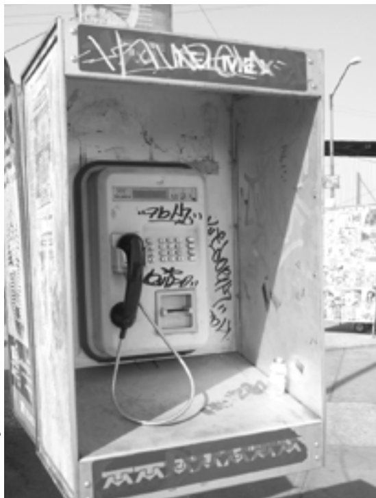
Calzada La Viga, Venustiano Carranza

ocho meses, yo entré, fui el tercero del LEP y bueno, ¿qué significó para mí? Lo que sea de cada quién tuvimos un récord rayando, fuimos hasta buscados por la policía, unos del metro. Fuimos uno de los primeros porque nada más estaba el CHK (los Kids Hate Cops). Era por ahí del 87 más o menos, ellos empezaron por el 86 y yo por el 87. La verdad entré bien papanatas; yo empecé haciendo plaquitas y tatuaba, pero hasta ahí.