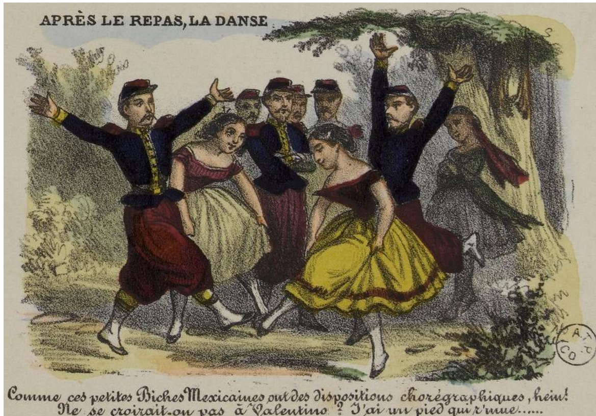
Figura 4. “Nos troupiers au Mexique. Après le repas, la danse. Comme ces petites Biches Mexicaines ont des dispositions chorégraphiques, hein! Ne se croirait-on pas à Valentino? J’ai un pied qui r’mue...”. Imagerie Nouvelle , serie 8, plancha 59. Litografía.