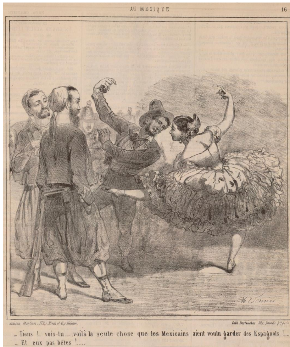
Figura 1. “-Tiens!... vois-tu..., voilà-là seule chose que les Mexicains aient voulu garder des Espagnols!... -Et eux pas bêtes!...”. Charles Vernier. Le Charivari , 7 mayo 1862, año 31, p. 16. Litografía de Destouches, París.