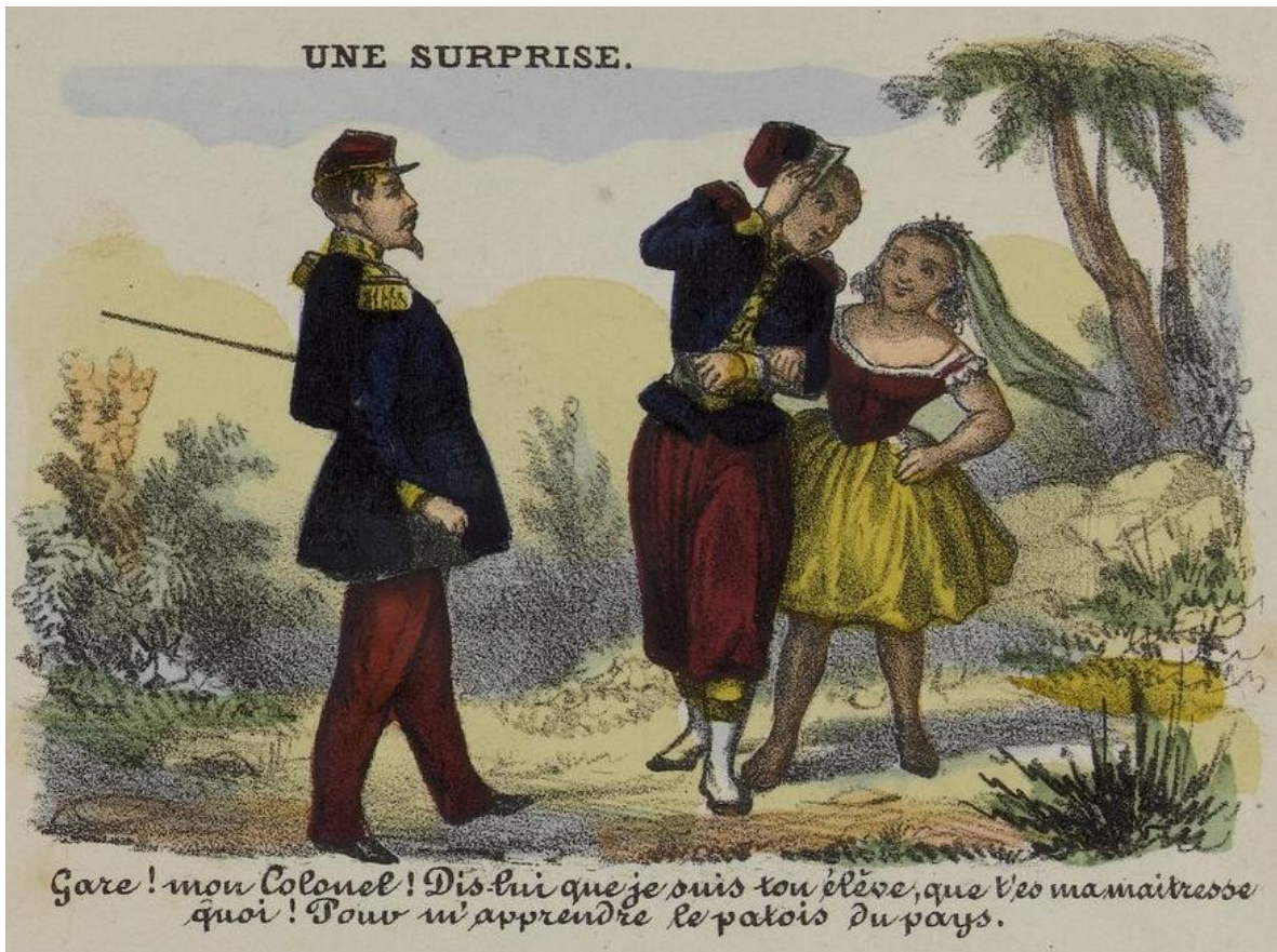
Figura 5. "Nos troupiers au Mexique. Une surprise. Gare! Mon Colonel! Dis-lui que je suis ton élève, que t'es ma maitresse quoi! Pour m'apprendre le patois du pays". Imagerie Nouvelle , serie 8, plancha 59. Litografía.