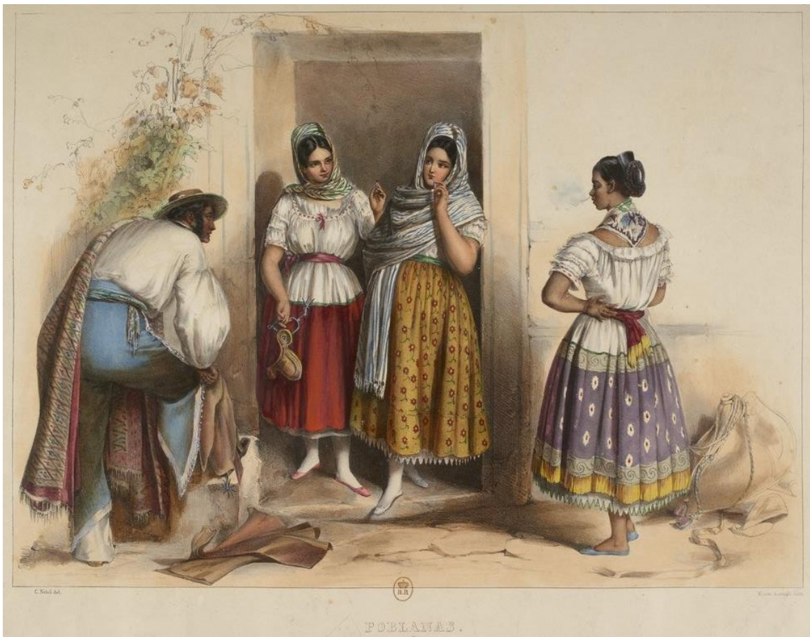
Figura 2. "Poblanas". 1836. Carl Nebel. Voyage pittoresque et archéologique dans la partie la plus intéressante du Mexique . Litografía.