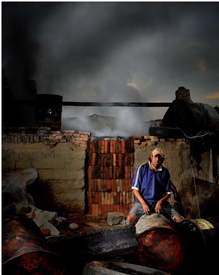
LA QUEMA EN EL HORNO (METEPEC, ESTADO DE MÉXICO, 31 DE AGOSTO DE 2012)