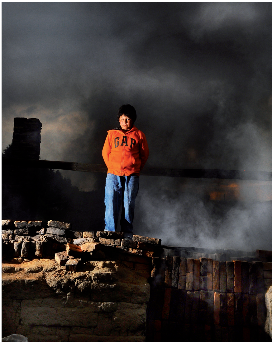
EL HUMO NEGRO (METEPEC, ESTADO DE MÉXICO, 31 DE AGOSTO DE 2012)