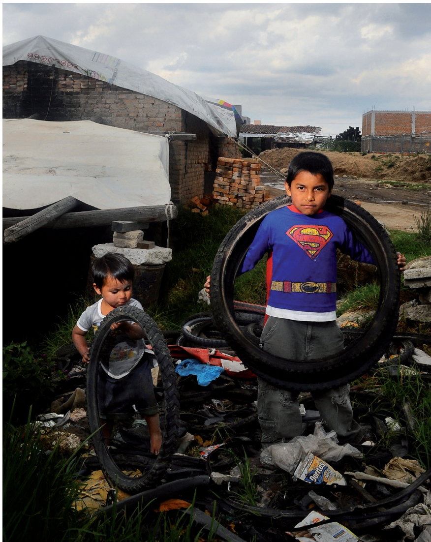
RECOLECTANDO EL MATERIAL COMBUSTIBLE (METEPEC, ESTADO DE MÉXICO, 31 DE AGOSTO DE 2012)