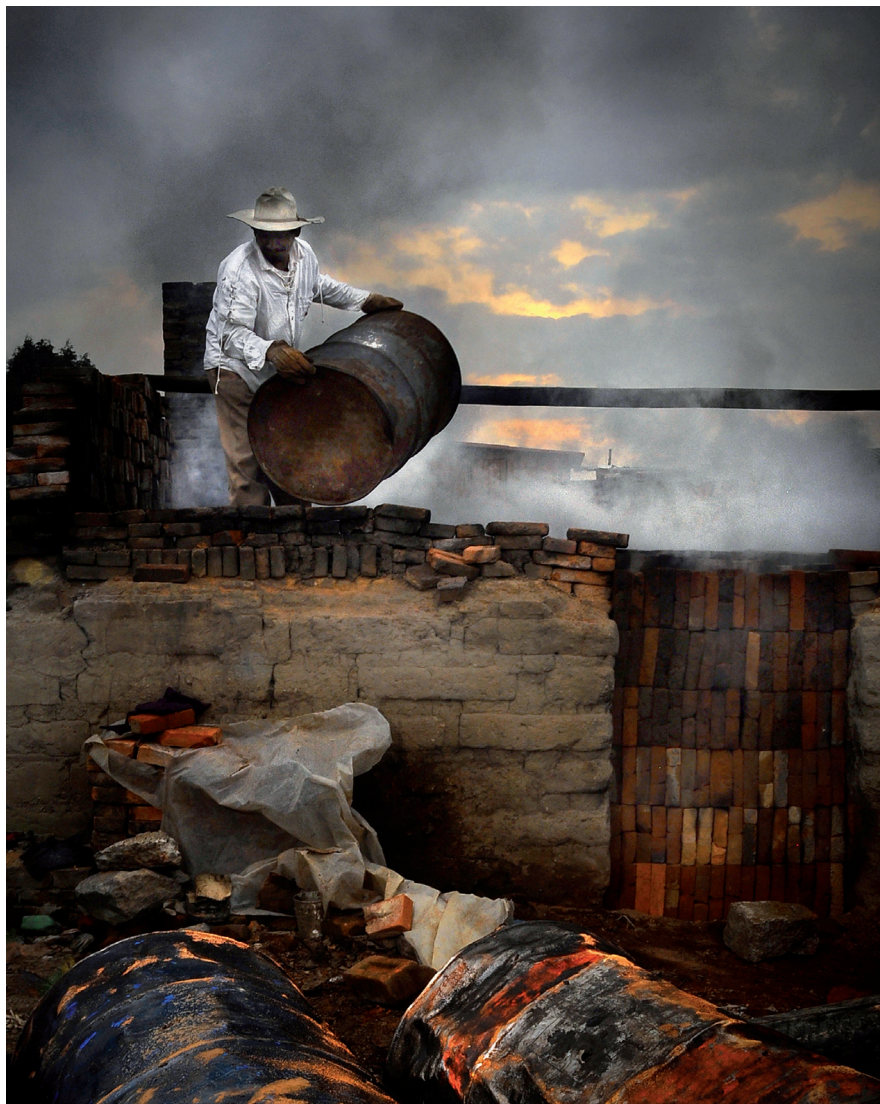
AVIVANDO EL FUEGO (METEPEC, ESTADO DE MÉXICO, 31 DE AGOSTO DE 2012)