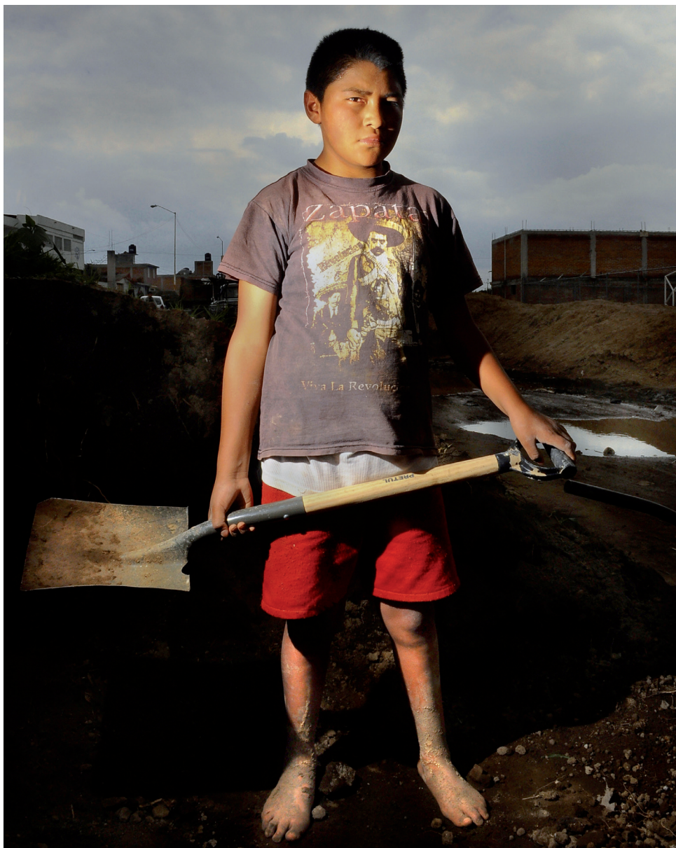
INICIANDO LA JORNADA (METEPEC, ESTADO DE MÉXICO, 20 DE JULIO DE 2012)

Cuicuilco número 58, septiembre-diciembre, 2013