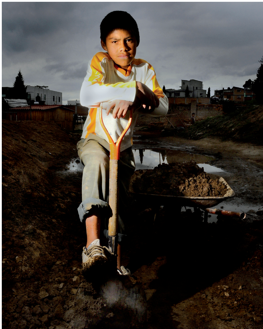
PREPARANDO LA ARCILLA (METEPEC, ESTADO DE MÉXICO, 20 DE JULIO DE 2012)