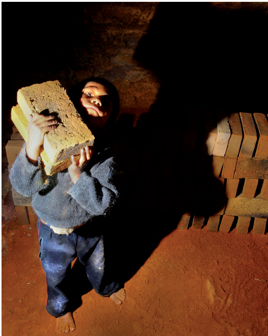
PRODUCTO TERMINADO (METEPEC, ESTADO DE MÉXICO, 26 DE JULIO DE 2012)