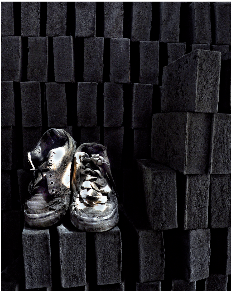
LISTOS PARA LA QUEMA (METEPEC, ESTADO DE MÉXICO, 24 DE JULIO DE 2012)