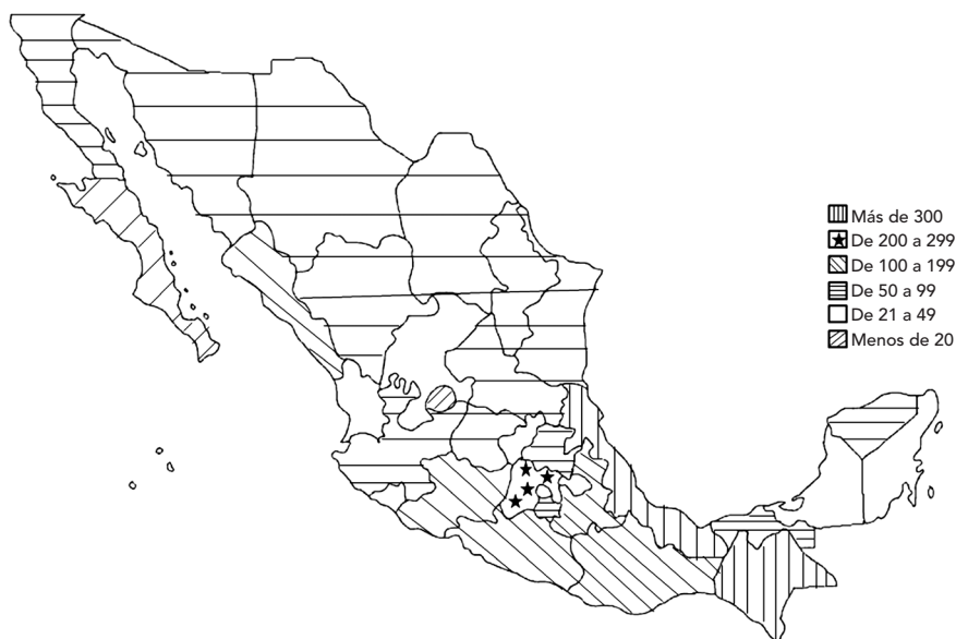
Mapa 3. Salones del reino por entidad federativa (2011)

En 1991 se constituyó en la sucursal nacional mexicana el Departamento de Construcción de Salones del Reino y se crearon los primeros 31 comités regionales de construcción, que en 1999 habían edificado un total de 181 recintos. Dos años antes la sede mundial de la WTBs estableció el Programa de Construcción de Salones del Reino en países con recursos limitados, lo que significó que en México se recibiera ayuda financiera de esa instancia para la construcción de dichos inmuebles. En cuatro años se alcanzaría la