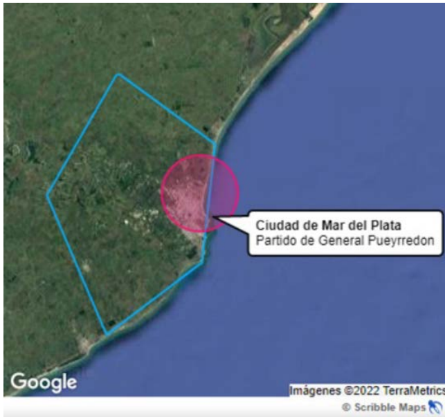
Figura 2 Mar del Plata (partido de General Pueyrredon)