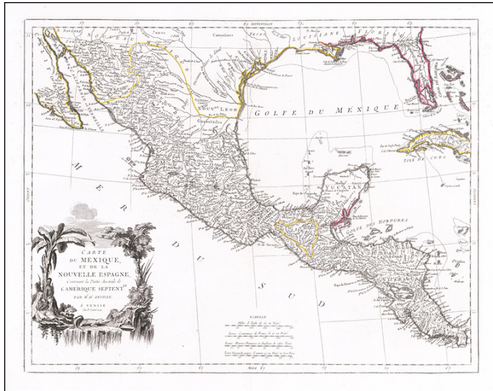
Figura 7. Carte du Mexique et de la Nouvelle Espagne , 1779, Paolo Santini, colección de Barry Lawrence Ruderman. < https://www.raremaps.com/gallery/detail/61020/carte-du-mexique-et-de-la-nouvelle-espagne-contenant-le-part-santini >. Consultado el 16 de marzo de 2020.

Con estos casos expuestos se quiere hacer énfasis en la permanencia de un núcleo amplio de rebelión y resistencia por parte de los habitantes nómadas y seminómadas del Norte de México, también extendidos hacia el suroeste de los Estados Unidos, además fueron perseguidos no sólo físicamente sino, de igual manera, en el discurso gráfico y escrito, el cual sigue manteniendo una permanencia tan arraigada que en la mayor parte de la historiografía del norte mexicano y de las investigaciones arqueológicas de la misma región es casi automático el empleo de los referentes a la posición de asentamientos españoles como: “constituía una excelente defensa natural contra las incursiones de los indios bárbaros que atacaban” [Güerica 2018: 73], por supuesto, siempre desde la mirada del colonizador como el agente agredido, quien deja así, de una forma inconsciente, a los pueblos originarios como los antagonistas y no al contrario (figura 8).