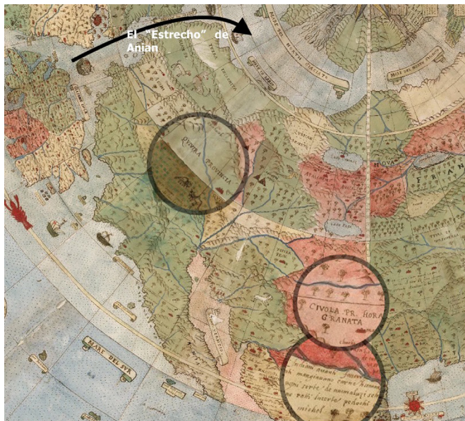
Figura 3. Fragmento del mapamundi de Urbano Monte de 1587, correspondiente a la Tavola X Che Ha Sua Superiore La Tavola Terza. Libro Terzo , al Norte de México, California y gran parte de Norteamérica. Se resaltan en los círculos Quivira y Cíbola, las míticas ciudades de oro, también la anotación referente al consumo de carne humana por los indios no subyugados y la referencia al estrecho o provincia de Anian o paso

gura 4) y parte del este de México con dirección al occidente; esta representación puede ser la referencia a su incursión de 1529 y más adelante se convertiría en la provincia de la Nueva Galicia [García Icazbalceta 1999]. La representación de un gran río puede deberse al de Pánuco en Veracruz, provincia donde fue gobernador. Es de extrañar la ausencia de la Laguna de Chapala, a pesar que en los planos de Ortelius sí se identifica; ésa fue la primera de muchas expediciones que otros seguirían al territorio nómada y donde iniciaría el proceso de conquista y colonización a “sangre y fuego”. Es necesario recordar cuando Beltrán Nuño de Guzmán comisionó a Gonzalo López en 1530 para cruzar la Sierra Madre Occidental desde Culiacán. Si bien no es posible determinar con certeza hasta dónde llegó su empresa, sus comentarios son muy interesantes. López describió dichas llanuras como desiertos despoblados, donde no había sino indios “salvajes” sin caminos ni poblados; la expedición fue tan cruenta que refirió, de no haber sido por un poco de maíz que había dejado enterrado, todos hubieran muerto [García Icazbalceta 2004].