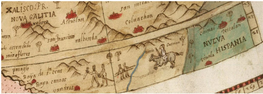
Figura 4. Detalle de la Tavola anterior, donde se representa a Nonio de Guzmán (Nuño de Guzmán) iniciando su expedición de Pánuco al occidente mexicano. Fuente: David Rumsey Map Collection. Consultado el 12 de junio de 2022.

Fuente: David Rumsey Map Collection. < https://www.davidrumsey.com/luna/servlet/detail/RUMSEY~8~1~303567~90074180:Tavola-X-Che-Ha-Sua-Superiore-La-Ta?qvq=q%3Apub_list_no%3D%2210130.000%22%3Bsort%3Apub_list_no%2Cseries_no%3Blc%3ARUMSEY%7E8%7E1&sort=pub_list_no%2Cseries_no&mi=11&trs=94 >. Consultado el 12 de junio de 2022.