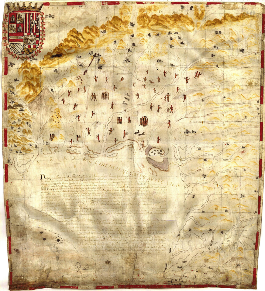
Figura 8. Descripción y mapa de la nueva provincia poblada de bárbaros, situada en la Costa del Seno Mexicano, desde el Puerto de Tampico hasta la provincia de Texas, 1744. Autor: Miguel Custodio Durán.