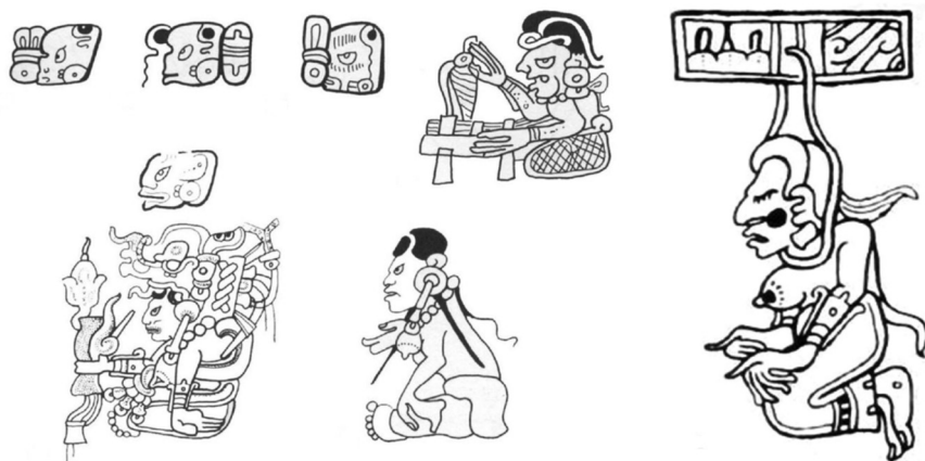
Ilustración 2. Diferentes representaciones de la deidad lunar maya Ix Sak Uh. Representaciones de códices a) Dresde , página 22b; b) Dresde , página 16c; c) Madrid , página 107; d) Dresde , página 49; e) Madrid , página 102; f) Dresde , página 16c y por último g) Dresde , página 53.

El contexto con el cual se presenta dicha imagen también nos provee información que respalda esta nueva lectura, primero porque en la tabla donde aparece la mujer, la soga está sobre un elemento conocido como la banda celeste que representa a la vía láctea o en otras ocasiones a un conjunto de estrellas durante la noche. Aunque de ella se cruza una soga que le rodea el cuello, por lo que parece estar en una horca en un acto suicida, en ningún lugar de ese contexto cercano puede leerse ningún nombre relativo a Ixtab. En segunda instancia, ese segmento es parte de otro mayor conocido como las tablas de los eclipses, que comienza en la página 50 y termina en la página 58 [ilustración 3], donde se mencionan con suficiente reiteración los ciclos de la luna, aludiendo a la deidad lunar ya mencionada (Ix Sak Uh). En algunas ocasiones, como parte de épocas de bonanza y cuando se refiere a los eclipses, es justo en la página 53 donde aparece la imagen a la que los primeros mayistas asumían como Ixtab.