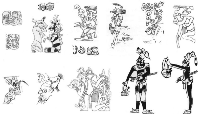
Ilustración 4. Deidad de la cacería (Venado) llamada Hu Zip o Tabay, en sus diferentes representaciones en códices, murales y pinturas. [Tomado de Ishahara 2009].

2006: 52] por la soga que se encuentra pasando su cuello, con la que preferentemente se caza al venado (y que también la iconografía de la deidad de la caza, refiere al mismo). Tanto en su figura masculina ( Tabay ) como femenina ( XTabay ) nos remite que la obra de Landa cuando refiere al demonio de la cuerda , en realidad se refiere a la deidad de la cacería [ilustración 4].