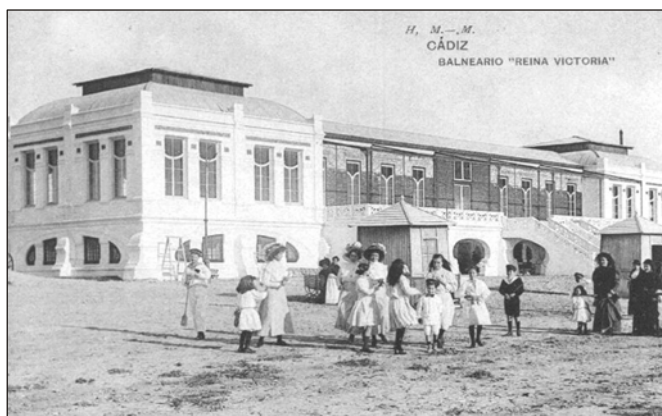
Figure 1. Postcard ( circa 1907) taken shortly after the inauguration of the Reina Victoria beach resort.

Más interesante desde un punto de vista técnico resulta la revisión de las afirmaciones que se hacen sobre las playas con laja rocosa (p. 260). Por ello, nos permitimos incluir algunos puntos que contribuyan a aclarar el funcionamiento morfosedimentológico de este tipo de playas apoyadas en un estrato rocoso de acuerdo con Muñoz-Pérez et al. (1999a). Empezaremos enfatizando la importancia de la geología subyacente. Muchos autores han estudiado diferentes fenómenos relacionados con la presencia de una laja rocosa en la playa: fluctuaciones en el nivel freático (Karunarathana y Tanimoto 1995), surf beat (Nakaza y Hino 1990), flujo de sedimento (Roberts 1980), set-up (Symonds et al. 1995). Sin embargo, debemos destacar la investigación referente a la rotura del oleaje y la consiguiente atenuación de su energía sobre una