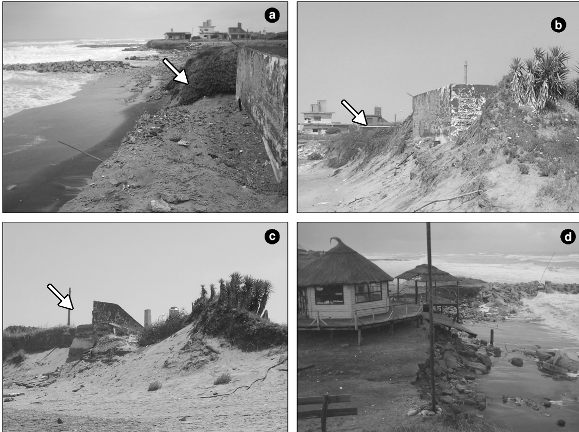
Figure 4. Cliff retreat to the left of San Martín Ave. during Sudestada storms in (a) May 2006, (b) October 2006, and (c) January 2007. (d) Collapsed building on the beach next to San Martín Ave. in May 2006.