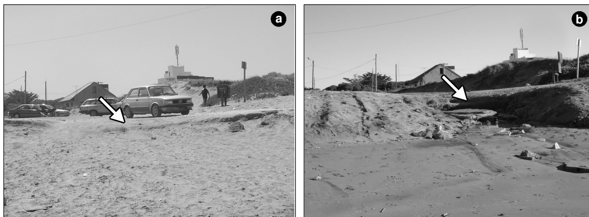
Figure 5. San Martín Ave. viewed from the beach: (a) January 2007 and (b) April 2007. Observe the rubble and the decrease in beach level.