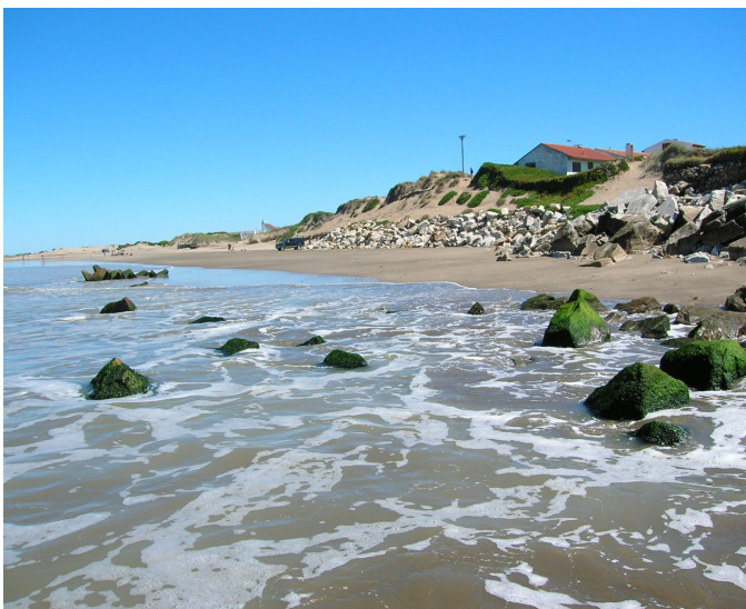
Figure 1. Coastline retreat at Parque Balneario Mar Chiquita, in Argentina. Figura 1. Retroceso de la línea de costa en el Parque Balneario Mar Chiquita, Argentina.

The study area is a small seaside resort located in the Municipality of Mar Chiquita, in southeastern Buenos Aires Province, 40 km to the north of the city of Mar del Plata (37°44'23.87" S, 57°26'35.31" W) (fig. 2). It is situated in the