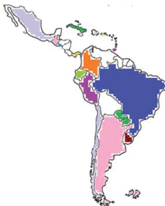
Figura 1. Países participantes de América Latina: Colombia, Argentina, Brasil, México, Paraguay, Perú, Guatemala, Chile, República Dominicana, Uruguay, Ecuador, Trinidad y Tobago, Puerto Rico, El Salvador, Panamá y Cuba.

Finalmente, la participación latinoamericana en esta colaboración ha sido sustancial, siendo Colombia y