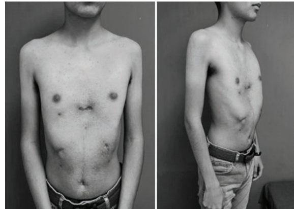
Figura 3. Resultado de la cirugía, 1 semana posterior al alta médica.

La cirugía tiene buenos resultados, sin complicaciones tempranas ni tardías y con una recuperación con dolor leve sin mayor necesidad de analgésicos potentes. En la figura 3 se muestran los resultados anatómicos de la cirugía de reconstrucción durante los primeros días posoperatorios.