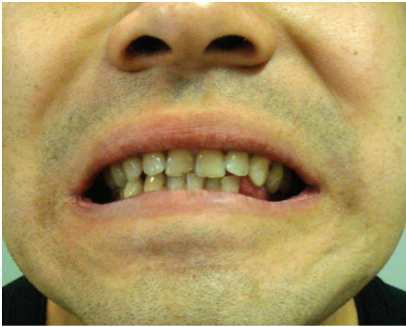
Figura 2. La oclusión es adecuada, la continencia oral es completa y el contorno facial permite una adecuada reintegración funcional y social. En estos casos con 10 años de seguimiento posoperatorio se considera un resultado estético y funcional satisfactorio, posterior a mandibulectomía y reconstrucción con colgajo de peroné.