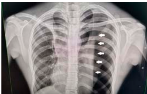
Figura 1: Neumotórax izquierdo.

Las lesiones bullosas que contactan con la pared torácica tienen una apariencia cóncava, a diferencia de la línea pleural del neumotórax espontáneo, la tomografía es el estudio de elección para detectar bullas subpleurales y