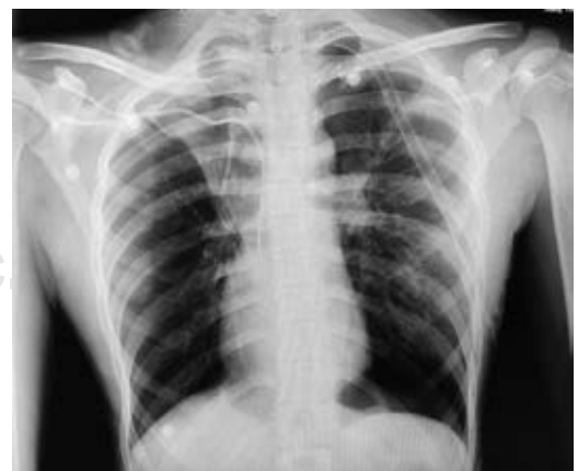
Figura 6: Radiografía tórax posterior a bullectomía.