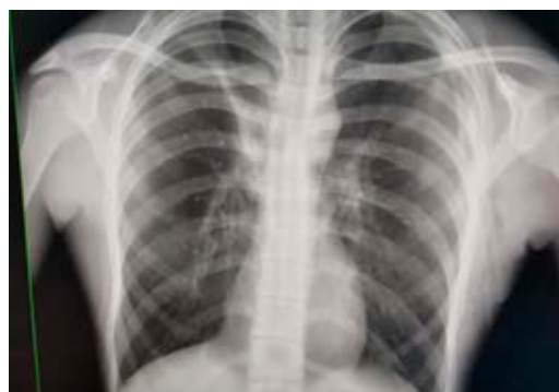
Figura 2: Postcolocación de sonda endopleural.

cambios enfisematosos causantes del neumotórax espontáneo primario. 10