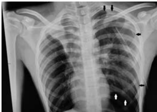
Figura 3: Neumotórax espontáneo. Las flechas identifican la silueta pulmonar en la radiografía de tórax aún sin expansión completa a pesar de la colocación de sonda pleural.