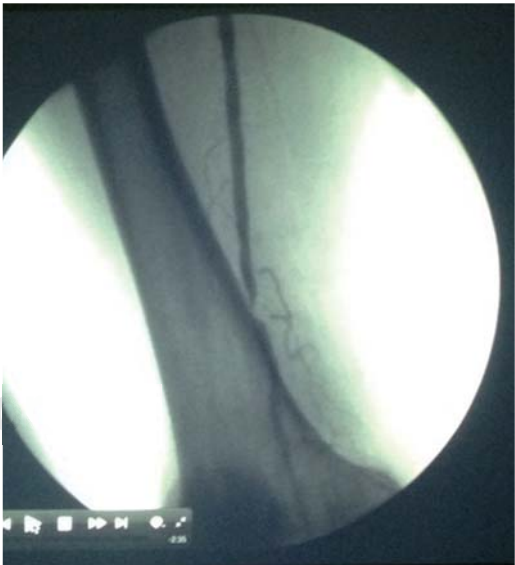
Figura 4. Arteriografía de la femoral superficial, mostrando oclusión de un cm en su tercio inferior.