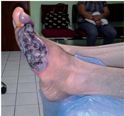
Figura 3. Características clínicas del pie izquierdo tratado previamente con ozonoterapia.