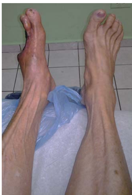
Figura 1. Comparación de extremidad inferior con lesión e íntegra.

después de recibir ozonoterapia, se le realizó resección del tercer y cuarto dedo por extensión del proceso inflamatorio y necrosis. Después del tratamiento quirúrgico, le continuaron con el de ozono. La paciente acudió a este centro por considerar que no obtenía la mejoría ofrecida, notando un deterioro progresivo de su pie y su herida quirúrgica, así como la presencia de náuseas, vómitos, malestar general y sensación de debilidad. En el examen físico se encontró a la mujer pálida, con sensación de ortopnea, polipneica y con facies de dolor. Los signos vitales fueron: frecuencia cardíaca (FC) 103 latidos por minuto, frecuencia respiratoria (FR) 20 respiraciones por minuto, temperatura 37.5 °C, tensión arterial (TA) 202/103 mmHg. En la exploración oftalmológica destacó la disminución de la agudeza visual y datos de retinopatía. Cuello, sin soplos ni ingurgitación yugular. Tórax, campos pulmonares sin estertores ni sibilancias, ruidos cardíacos arrítmicos, sin ruidos agregados. Abdomen, sin soplos. El miembro pélvico derecho presentó pulso femoral, poplíteo y pedio; sin alteraciones de importancia ( Figura 1 ). El miembro pélvico izquierdo presentó pulso femoral palpable, pulso poplíteo y pedio ausentes, lo cual fue corroborado por el estudio de Doppler