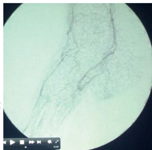
Figura 7. Arteriografía de la arteria dorsal del pie, mostrando su pobre visibilidad.