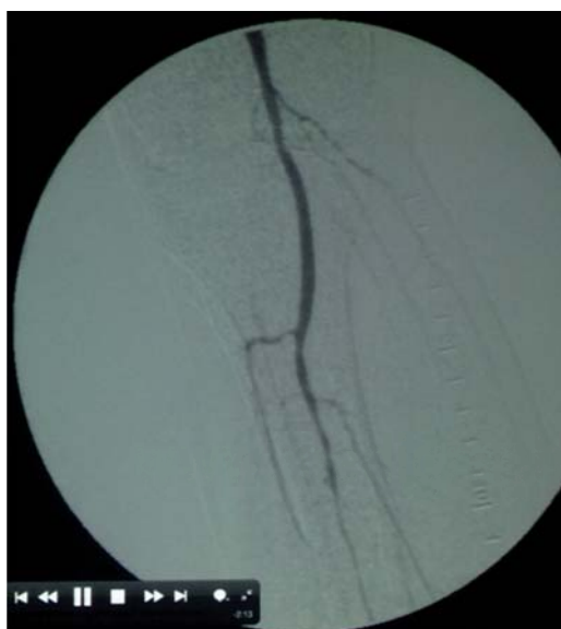
Figura 5. Arteriografía de vasos tibiales, mostrando la oclusión y estenosis multisegmentaria en su tercio superior.

que se expone es representativo de la inadecuada investigación clínica del sujeto, el empleo inapropiado de la terapia con ozono y la subestimación de la lesión. De acuerdo con los antecedentes clínicos de la paciente, la ubican con factores de riesgo (edad mayor de 60 años, prevalencia de EAP de más de 20%, presencia de diabetes mellitus de más de 10 años de