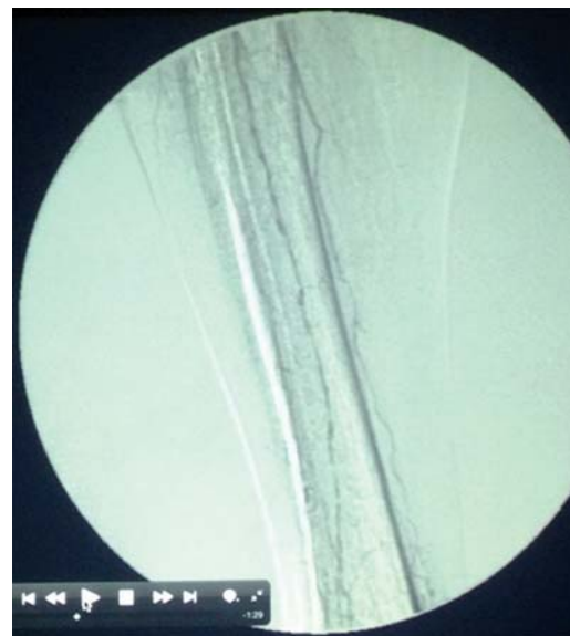
Figura 6. Arteriografía de vasos tibiales, mostrando estenosis multisegmentaria en el tercio medio e inferior.