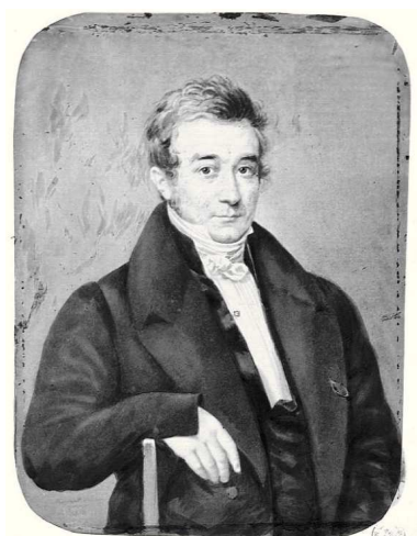
Figura 2 Antoine Germain Labarraqué (1777-1850), químico y farmacéutico francés, que destaca por la formulación de una solución de hipoclorito de sodio utilizado como desinfectante y desodorante.