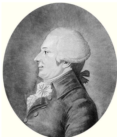
Figura 1 Louis-Bernard Guyton de Morveau (1737-1816), químico y político francés. Se le atribuye la producción del primer método sistemático de nomenclatura química.