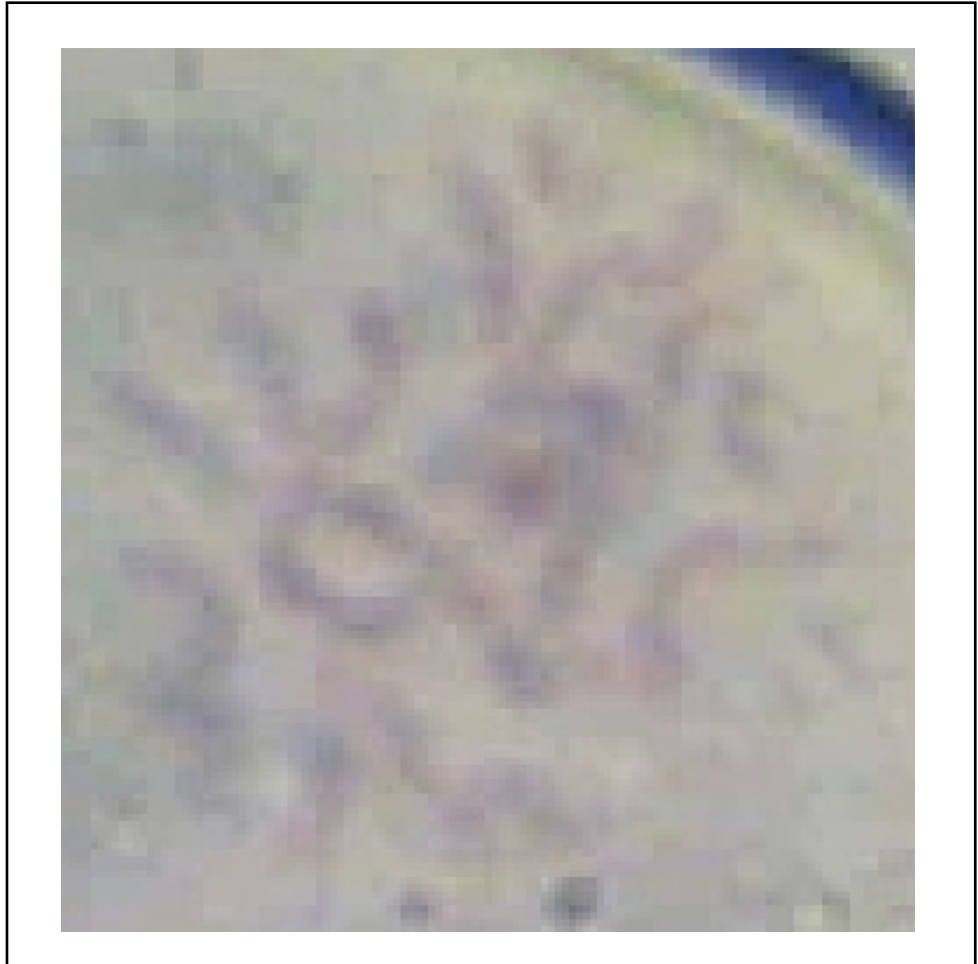
Figura 1. Cromosomas somáticos de Quercus laurina (Barra 5 \mu\text{m} ).

Q. dentata . Zoldos et al. (1999) opinan que la falta de diferenciación en cromosomas de especies de encinos sugiere que poseen un cariotipo común.