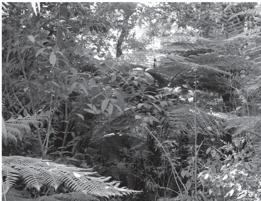
Figura 1. Población de Cyathea fulva en la cañada Río Frío.

y 2 mm de largo; todas estas características concuerdan con el material recolectado en la zona (figura 2). El taxón más cercano a C. fulva es C. divergens Kunze var. tuerckheimii (Maxon) R.M. Tryon que se distingue porque carece de tricomas, sus escamas son pardo oscuras, generalmente planas y se concentran principalmente en las axilas de las pinnas, además sus pínulas tienen pedicelos entre 1 a 6 mm de largo (Mickel y Smith, 2004).