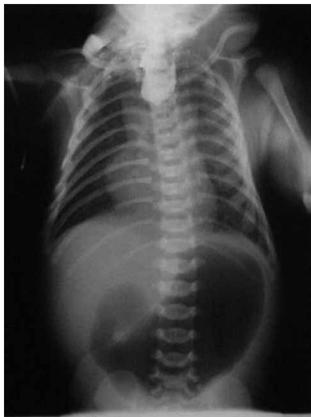
Figura 2. Imagen radiológica con medio de contraste de un recién nacido con atresia esofágica tipo III y atresia duodenal, donde se observa un cabo esofágico superior ciego, gran distensión de la cámara gástrica y parte inicial del duodeno, y ausencia de aire en el resto del intestino.

Como el tratamiento es quirúrgico, se deberán realizar exámenes de laboratorio preoperatorios (biometría hemática completa, recuento plaquetario y tiempos de coagulación). Además, con objeto de descartar otras malformaciones, se podrán solicitar otros estudios como ultrasonido renal, cardíaco y transfontanelar, así como radiografías de radio y columna. También puede indicarse el análisis cromosómico. 7