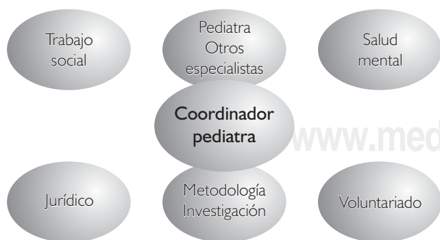
Figura 1. Estructura Orgánica de la Clínica de Atención Integral al Niño Maltratado del Instituto Nacional de Pediatría, SSA.

El grupo paramédico lo integran profesionales de Trabajo Social, de Salud Mental, Enfermería, Nutrición; cada uno podrá establecer algunos aspectos de la víctima, las características del entor-