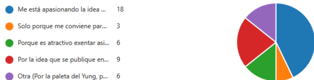
Gráfico No. 2.- El interés de hacer investigación