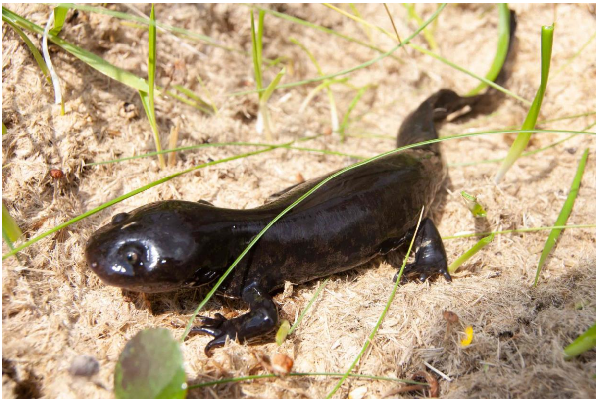
Figura 3. Individuo adulto metamórfico de Ambystoma rivulare del Área de Protección de Flora y Fauna Nevado de Toluca, municipio de Amanalco, Estado de México; ha perdido branquias y aleta dorsal.

vulnerabilidad a la degradación ambiental: baja (3–9), media (10–13) y alta (14–19) (Wilson & McCranie, 2003). A manera de referencia, se menciona qué criterios de la SEMARNAT son análogos con los de la UICN, pues según esta organización las tres especies enfrentan un riesgo de extinción muy alto en vida silvestre (EN), lo que se podría considerar un nivel de riesgo más alto que el que les otorga la SEMARNAT en México (A), indicando únicamente que podrían estar en peligro de desaparecer de seguir operando factores negativos (e.g., deterioro del hábitat) sobre sus poblaciones, esta disparidad puede ser un indicio más de que el estado de conservación de los ajolotes de arroyos de alta montaña debe ser revisado.