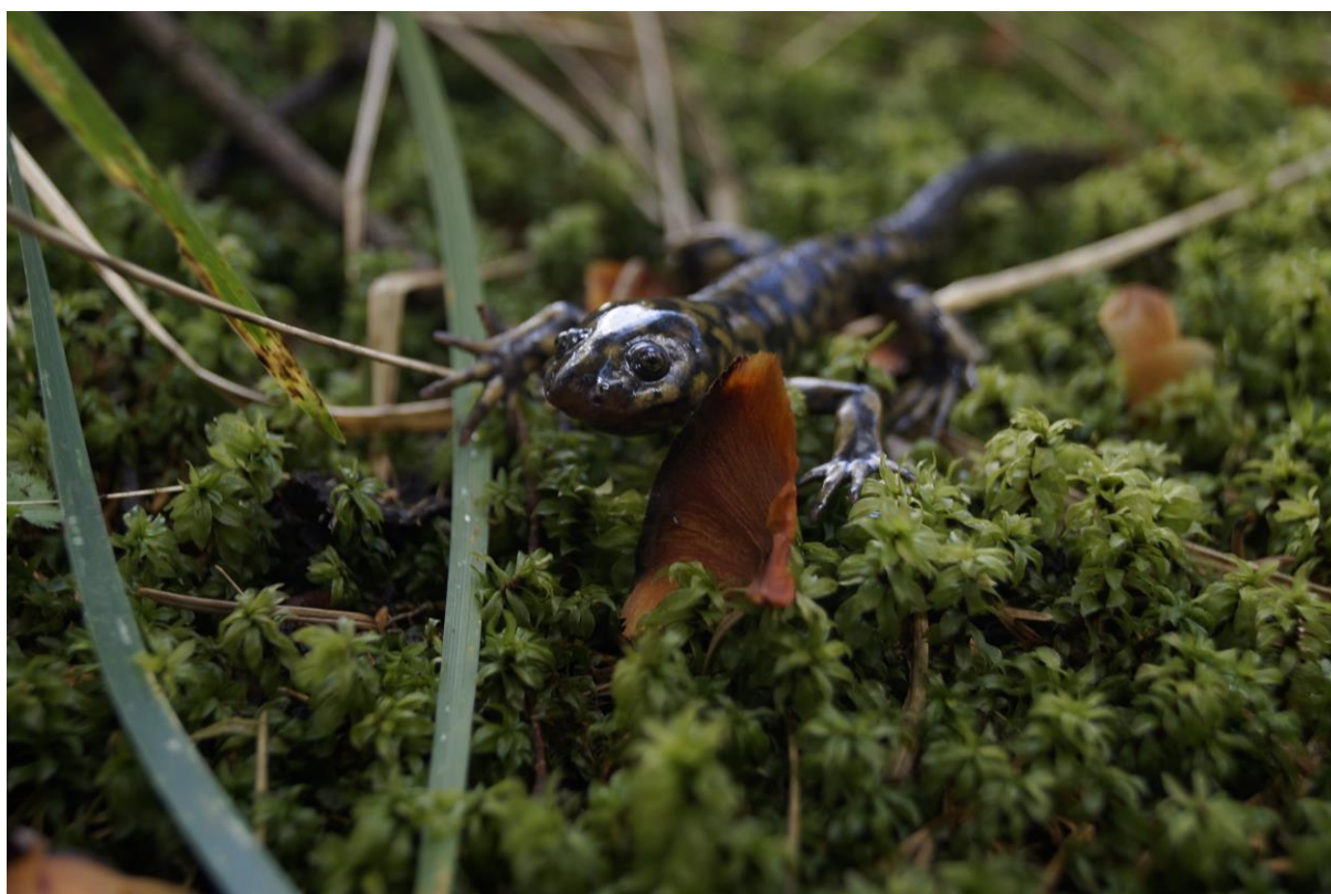
Figura 1. Ejemplar adulto metamórfico de Ambystoma altamirani del municipio Isidro Fabela, Estado de México; se puede observar que ha perdido las branquias y la aleta dorsal.

(SEMARNAT, 2010), algunos de estos criterios coinciden parcialmente con los de la Unión Internacional para la Conservación de la Naturaleza (IUCN), la cual, hasta septiembre de 2021, cataloga como especies en peligro (EN) a A. rivulare (IUCN SSC Amphibian Specialist Group, 2020a) y A. altamirani (IUCN SSC Amphibian Specialist Group, 2020b) debido a serias disminuciones poblacionales y a la disminución de la cantidad y calidad de su hábitat, mientras que a A. leorae se le cataloga como especie "críticamente amenazada" (CR; IUCN SSC Amphibian Specialist Group, 2020c) debido a que la extensión de su presencia es menor a 100 km 2 y todos los individuos se encuentran en una sola población (Shaffer et al. , 2008a; b; Sunny et al. , 2014a; b). Por su parte, la SEMARNAT, hasta noviembre de 2019, cataloga a las tres especies de ajolotes de arroyos de alta montaña ( Ambystoma spp.) dentro de la NOM-059-SEMARNAT-2015 en la categoría de amenazadas (A) lo que significa que podrían desaparecer a mediano o largo plazo si siguen operando los factores que inciden negativamente en la viabilidad de sus poblaciones (Shaffer et al. , 2008 a; b; SEMARNAT, 2010).