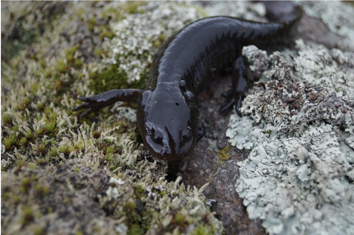
Figura 2. Individuo neoténico de Ambystoma leorae del Monte Tláloc, Puebla, conserva las branquias y la aleta dorsal.

específicamente para los anfibios, el grado de especialización reproductiva (pues poseen un ciclo de vida bifásico). A medida que el índice obtenido en cada uno de estos componentes aumenta, aumenta el grado de vulnerabilidad de la especie a la degradación del hábitat (Wilson & McCranie, 2003; Wilson et al. , 2013).