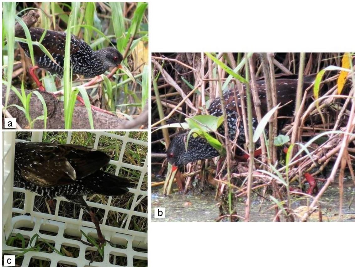
Figura 2. a) Rascón pinto observado en un estanque en Peñuela, Amatlán de los Reyes. b) Rascón pinto alimentándose de lentejas de agua en Peñuela. c) Liberación del rascón pinto encontrado en Orizaba.

El segundo registro tuvo lugar el 16 de febrero de 2015, a unos 20 km al oeste del sitio en Peñuela. Se nos informó de un P. maculatus que llegó al patio de un domicilio particular en las afueras de la ciudad de Orizaba ( 18^{\circ} 50' 28'' N; 97^{\circ} 5' 16'' O; 1,230 msnm; Fig. 1). Cabe mencionar que, aunque este registro ocurrió en una zona urbana, Orizaba cuenta con numerosos cuerpos y corrientes de agua de donde podría haber provenido este organismo. El ave fue capturada y dado que se encontraba en buena condición física, se le liberó en un cuerpo de agua rodeado por pastos altos, la laguna el Novillero ( 18^{\circ} 53' 3'' N; 97^{\circ} 6' 3'' O; 1,300 msnm; Figura 2c), a unos 5 km de distancia.