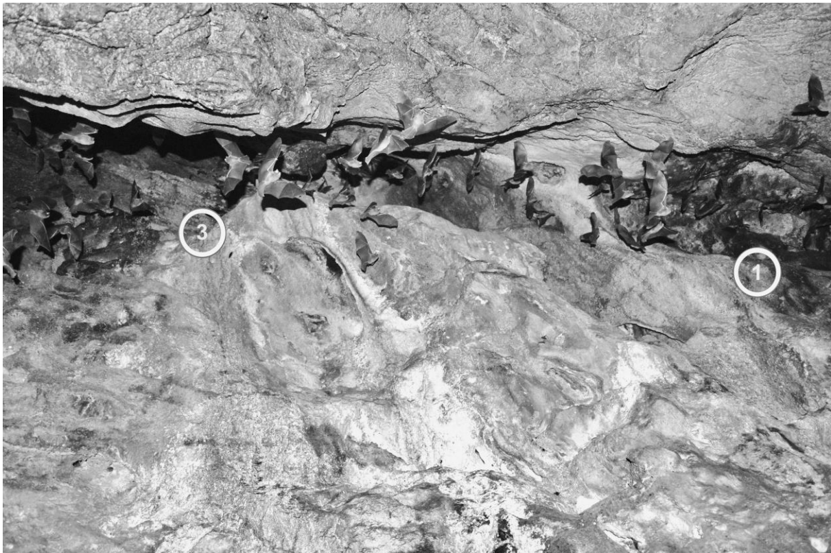
Figura 2. Flujo de salida de los murciélagos Natalus mexicanus en el techo de la cueva de “Los Laguitos”, Chiapas. Los números indican los sitios de observación de los ataques primero (1) y tercero (3) del ciempiés gigante ( Scolopendra sumichrasti ) sobre el murciélago.

Algunos de los registros previos publicados de depredación de ciempiés gigantes sobre murciélagos, se documentaron con fotografías y notas de observación a poca distancia y, en algunos casos, por lapsos de hasta 30 minutos (Molinari et al. , 2005). Sin embargo, los ciempiés de la cueva de “Los Laguitos” siempre huyeron cuando fueron descubiertos e iluminados. En Texas, Lindley et al. (2017) reportaron que S. heros liberó a su presa, Eptesicus fuscus (Palisot de Beauvois, 1796), ante la presencia humana y, aunque el murciélago fue mordido en el cuello, se observó arrastrarse media hora después del ataque. Finalmente, las observaciones realizadas en este trabajo, evidencian que S. sumichrasti es la cuarta especie de ciempiés del género Scolopendra que ataca murciélagos (Lindley et al. , 2017).