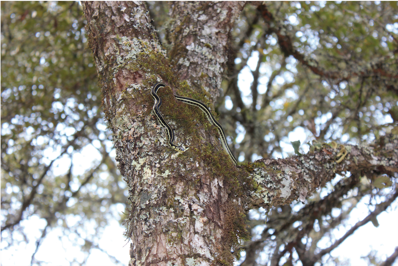
Figura 1. Ejemplar de Thamnophis pulchrilatus observado en árbol de encino a 4.96 m del suelo.