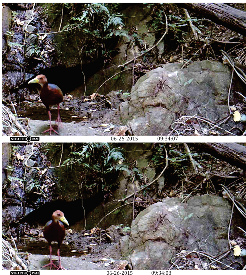
Figura 1. Fotocaptura de Aramides axillaris tomadas en el ADVC El Gavilán, Municipio de Santa María Tonameca, Oaxaca.

2002). La mayoría de las especies de este grupo presentan cuerpos angostos que les permiten movilizarse fácilmente entre la vegetación, sin ser vistos o escuchados (Taylor 1998, Bolaños & Alvarado 2012). Consideramos que el presente registro del rascón cuellirufó es notable por dos razones: la altitud y la vegetación. El ADVC El Gavilán es una ANP relativamente pequeña y hasta la fecha no se contaba con registro alguno sobre la presencia del rascón dentro de su polígono, e incluso las personas que integran el grupo comunitario de protección de esta ANP mencionan que no conocían a esta especie. El sitio del registro se ubica dentro del núcleo agrario de San Francisco Cozoaltepec, en el Municipio de Santa María Tonameca, justo en la región donde se considera inician las altas montañas de la Sierra Sur y que superan los 1000 m de altitud. En el estado de Oaxaca, el registro más cercano de esta especie se ubica a 51 km en línea recta en la Laguna de Manialtepec, Oaxaca (Fig. 2).