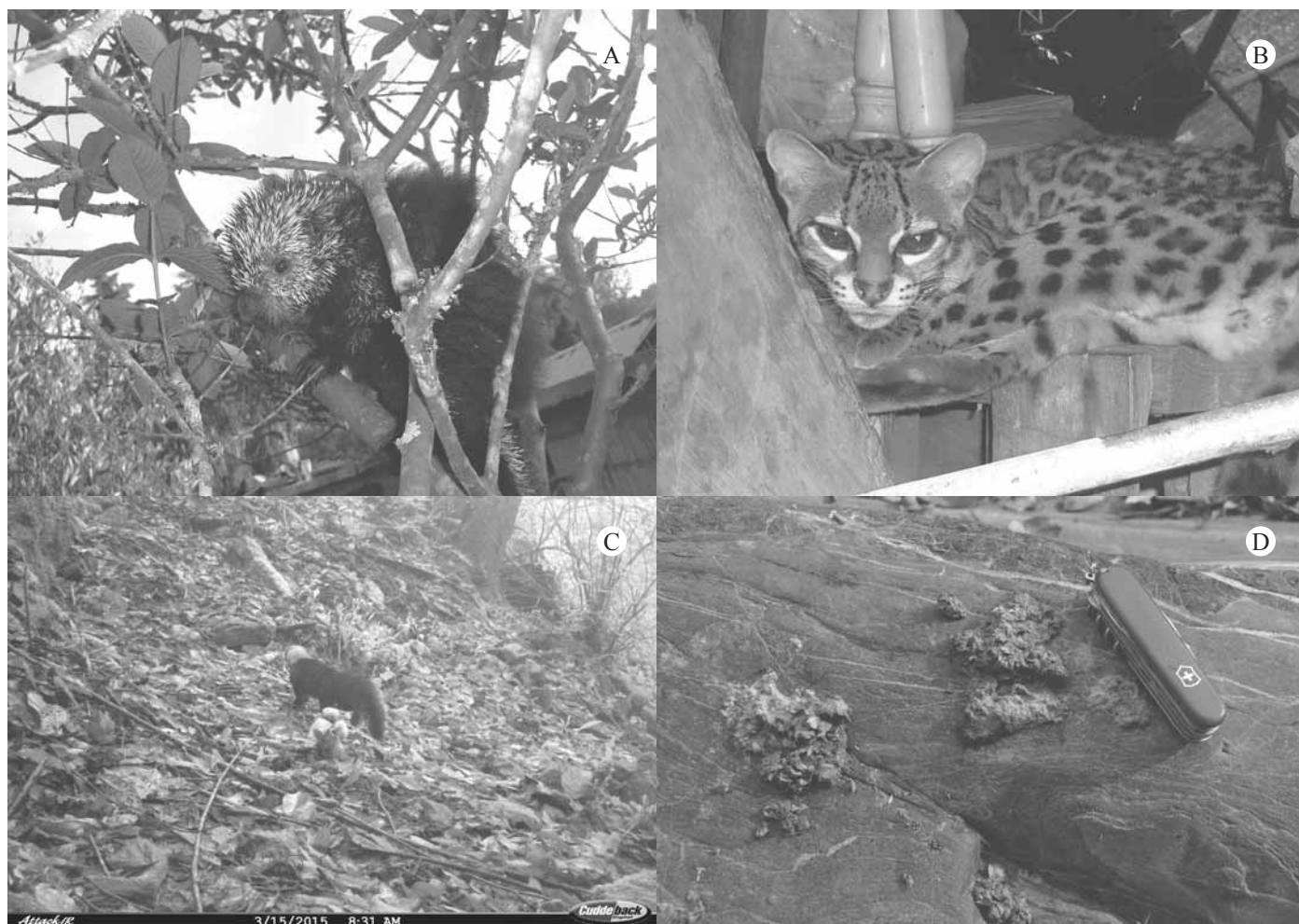
Figura 2. Registros fotográficos de a) Coendou mexicanus , b) Leopardus wiedii y c) Excreta de Lontra longicaudis y d) Eira barbara .

Neotomodon alstoni Merriam, 1898. Se examinaron cuatro ejemplares. Una hembra adulta, dos machos subadultos y un macho adulto, capturados a 0.7 km al N de Las Vigas, municipio de Almoloya (19°43'22.72"N, 98°15'44.85"W), a una altitud de 2,899 m. Sólo se coleccionaron dos individuos; un macho subadulto (HGO-MAM-1295) y una hembra adulta gestante con dos embriones (HGO-MAM-1296), el resto fueron liberados en el sitio de captura. Se registraron el 16 de octubre de 2010, en el borde de un bosque de pino-encino y un zacatonal. La especie fue citada en otra localidad de Almoloya, a 2.4 km al NW de San Juan Violeta, a 2,817 m (García-Becerra et al. 2012) y los especímenes que mencionamos se encon-