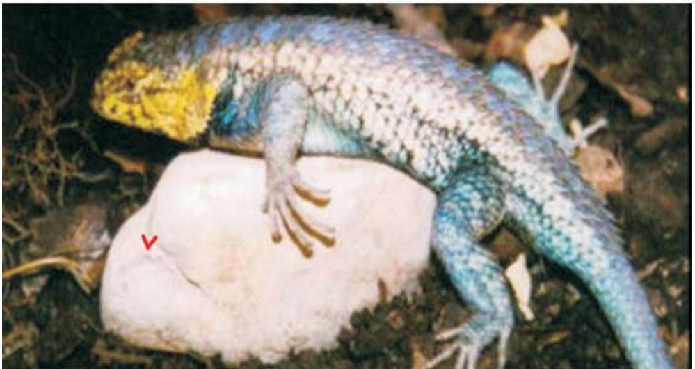
Figura 1. Coloración dorsal de machos de Sceloporus h. horridus . Arriba el morfo de color azul y abajo el morfo de color amarillo.