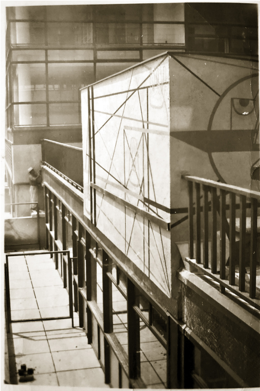
Figura 8. Mural de las terrazas durante la construcción. Nótese al albañil colocando mosaico. Fotografía de Edna Hidalgo. Imagen del Archivo Guillermo González.

En los artículos de las citadas revistas, pareciera que el condominio era la solución a la expansión horizontal de la ciudad, dando por hecho dos premisas: que sólo la construcción de vivienda era la responsable de la expansión de la mancha urbana y que la construcción de edificios de departamentos dependía del condominio. Como podemos intuir, esto es falso por dos razones: en primer lugar, fueron muchos los tipos de construcciones que ampliaron la mancha urbana de Ciudad de México y, en segunda instancia, los edificios de departamentos proliferaron mucho antes del régimen de condominio.