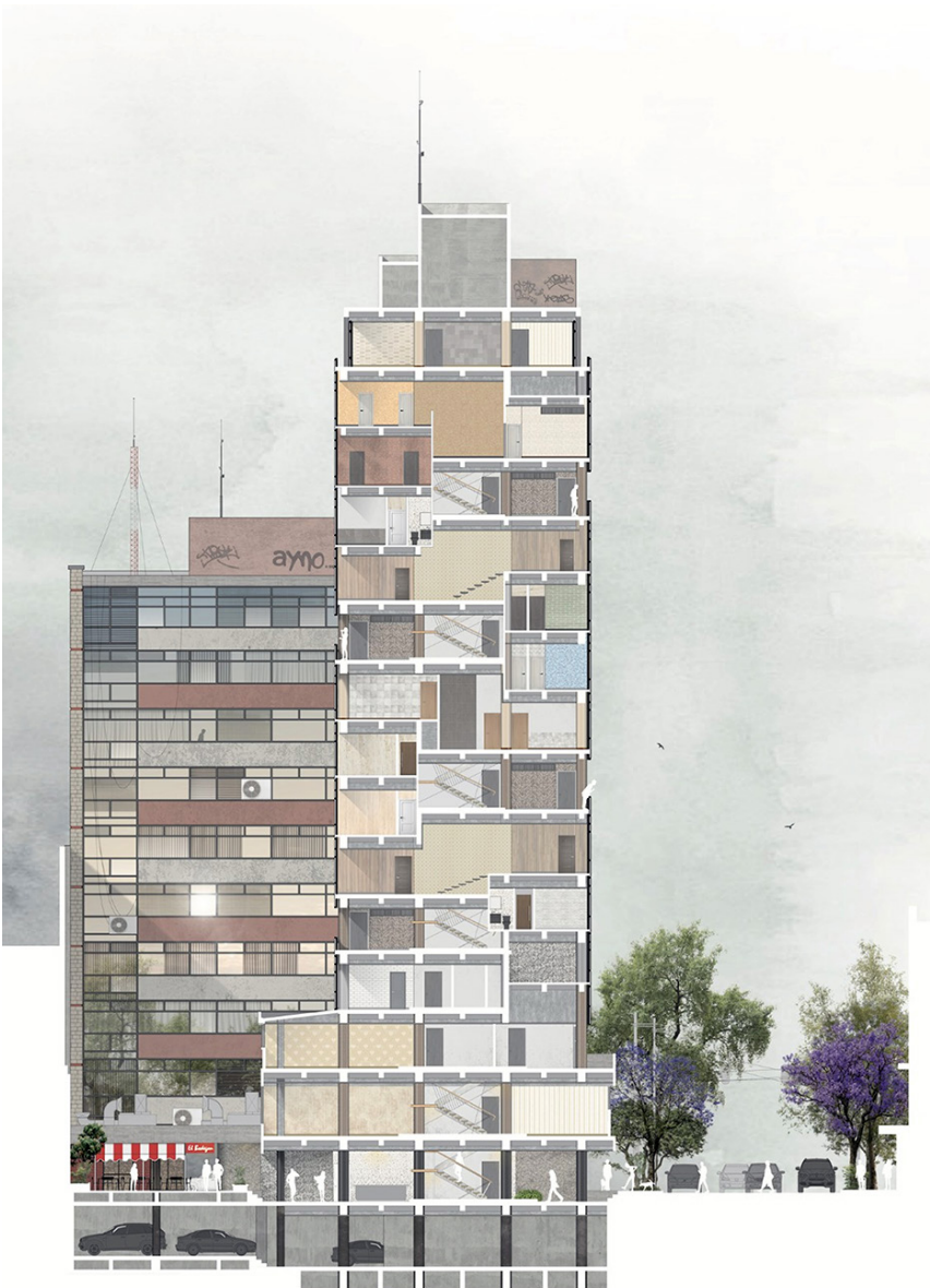
Figura 2. Corte de la torre de departamentos.

La fachada más célebre del conjunto se encuentra en el paramento de Reforma y es la cara sur de la torre de departamentos. Llamativa por los paneles de mosaico en zigzag que otorgan un