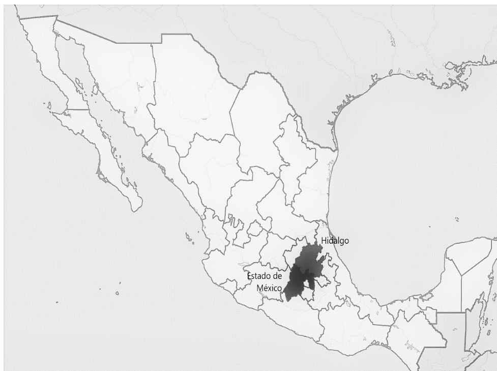
Figura 2. Ubicación de los estados Estado de México e Hidalgo en México.

Igualmente, se destaca que para los objetivos de este trabajo los RSU bajo estudio comprenderán aquellos materiales sólidos de desecho (basura sólida) que se producen en casas-habitación, además de oficinas, comercios y escuelas, sin importar si se puede o no reciclar (Araiza et al. , 2017; INEGI, 2013).