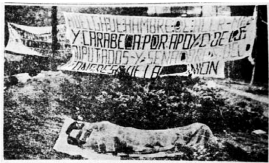
Trabajadores de Acer Mex y Carabeta, en huelga de hambre frente al Palacio Legislativo de San Lázaro, para demandar la reinstalación de mil obreros.

En cuanto a la revisión histórica de la fotografía de prensa en México, el recorrido general contempla los acontecimientos vividos a finales de la década de los años 70 y principios de los 80, tiempo en el que se identifica la primera parte del deno-