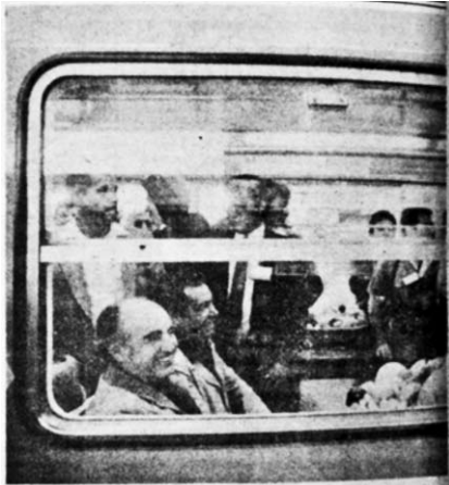
López Portillo durante la inauguración de la línea 4 del Metro

Con el cambio de estafeta, José López Portillo y Pacheco, quien se autodefiniría como el último presidente de la Revolución Mexicana, pidió en su toma de posesión: “una tregua inteligente para recuperar la serenidad y no perder el rumbo” e inició su mandato en medio de rumores, fuga de capitales, devaluación, déficit de la balanza de pagos, inflación, desempleo, alta deuda externa y supeditación de la política económica a las normas del Fondo Monetario Internacional (FMI). De ahí su búsqueda por restaurar el crecimiento económico, pero el espejismo petrolero lo llevó a la ruta del endeudamiento, sumiendo al país en una profunda recesión.