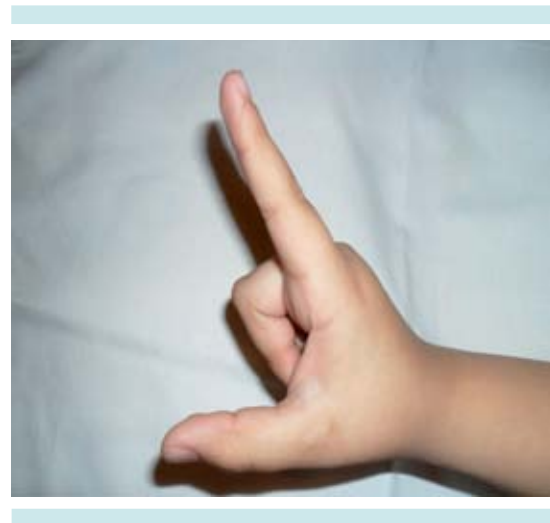
Figura 1. Señalización con la mano.

En los niños de más de 7 años de edad el autorreporte es lo mejor; lo que el niño nos dice respecto de su dolor y cómo lo define. Lo usual en esta edad es la Escala Visual Analógica (EVA), con números del uno al diez o la Escala Verbal