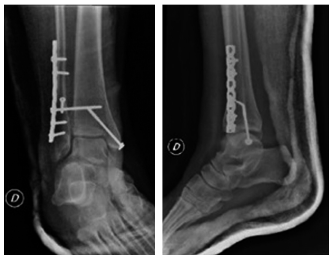
Figura 3: Par radiográfico de tobillo, proyecciones de mortaja y lateral postquirúrgicos.

Por otro lado, Marcin K Kolber y su equipo establecieron una clasificación de los pseudoaneurismas, también según su etiología, en postraumáticos a partir de esguinces o trauma directo, intraoperatorios como consecuencia de cirugía artroscópica o de Lisfranc y postquirúrgicos producidos por