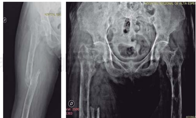
Figura 1: Radiografía anteroposterior de muslo derecho con fractura segmentaria de fémur. La radiografía anteroposterior de pelvis muestra lesiones líticas radiolúcidas en imagen de pompas de jabón, que corresponde a tumores pardos de hiperparatiroidismo.