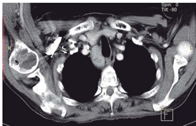
Figura 3: Resonancia magnética nuclear en corte axial, ponderada en T1 que muestra masa tumoral retrotiroidea y paratraqueal derecha en mediastino superior que corresponde a carcinoma paratiroideo.

tosas como tuberculosis (lugar de residencia) y sarcoidosis, además de hiperparatiroidismo primario por adenoma paratiroideo (por afección de hueso y cálculos renales), siendo la elevación de hormona paratiroidea (20 veces su valor normal en este caso) la confirmación para el diagnóstico (hasta ese momento) de adenoma paratiroideo por hipercalcemia, hipomagnesemia, fósforo en límites normales bajos y gran elevación de hormona paratiroidea (HPT) (con incidencia de 1/1,000, siendo la causa más frecuente de hipercalcemia, principalmente en mujeres postmenopáusicas); las imágenes líticas del fémur izquierdo correspondían a tumores pardos del hiperparatiroidismo acompañados de imagen en sal y pimienta observada en huesos de cráneo. Se efectuaron estudios de gammagrafía con tecnecio (9m Tc) sestamibi ( Figura 2 ) y resonancia magnética ( Figura 3 ) para localización del tumor en mediastino (ya que a nivel de cuello no fue palpable) y la planeación quirúrgica. Posterior a la cirugía, el estudio histopatológico y la inmunohistoquímica emitieron el diagnóstico definitivo de CP ( Figura 4 ); los niveles de paratohormona descendieron como era de esperarse a 40