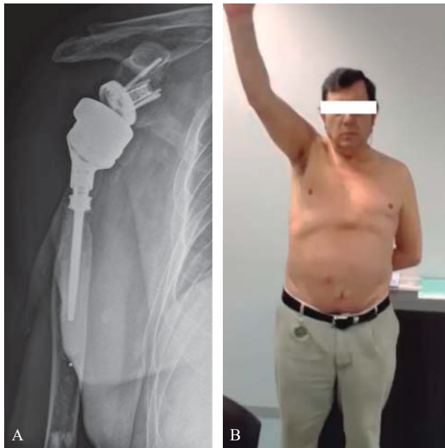
Figura 3. A) Segunda cirugía de revisión. B) Flexión de hombro después de todos los tratamientos quirúrgicos y tres años de evolución.

del paciente. En este caso, como en los demás casos publicados, se decidió extraer el implante porque consideramos que era imprescindible para conseguir erradicar totalmente la infección.