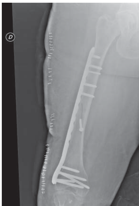
Figura 3. Control postoperatorio inmediato.