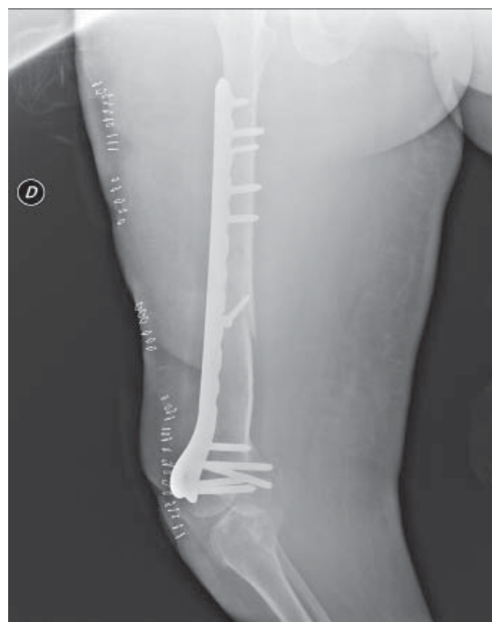
Figura 4. Control postoperatorio con reducción y fijación satisfactoria.

una fractura de la tibia proximal derecha. En la evaluación radiográfica de esta nueva fractura, la fractura del fémur derecho se veía completamente consolidada (Figuras 5 y 6).