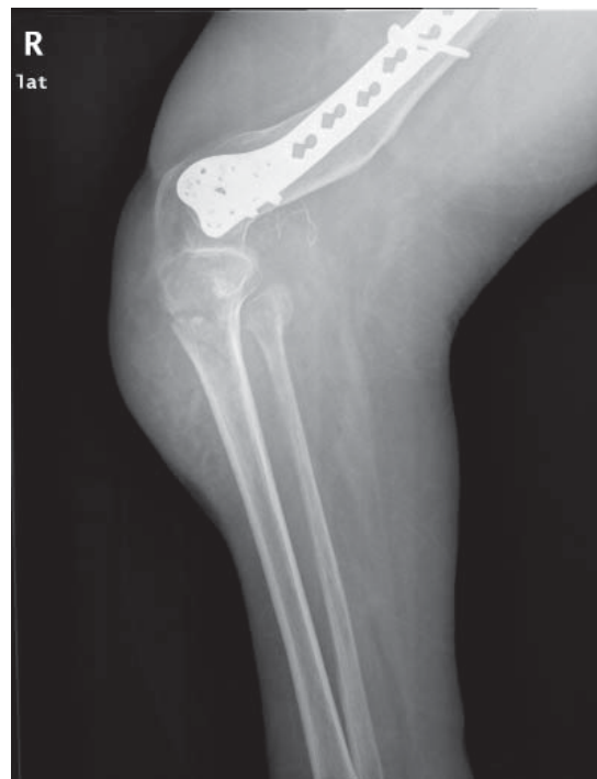
Figura 6. Vista lateral donde se aprecia la fractura proximal de tibia sin afectación al fémur.

algunas situaciones. En casos excepcionales, se puede realizar la fijación de fracturas femorales diafisarias utilizando placas. 8 En nuestro caso, la deformidad residual del fémur no permitió el uso de un dispositivo intramedular. Por este motivo, se decidió llevar a cabo la fijación de la fractura utilizando placas.