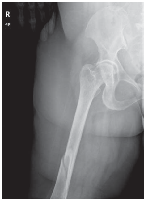
Figura 1. Proyección AP de la fractura de fémur.

Después de siete meses de seguimiento, la paciente se encontraba bien y la carga de peso fue progresivamente avanzando. Caminaba ayudada por muletas y una órtesis de rodilla de bloqueo de extensión de la rodilla. Desafortunadamente, sufrió una nueva caída accidental y se produjo