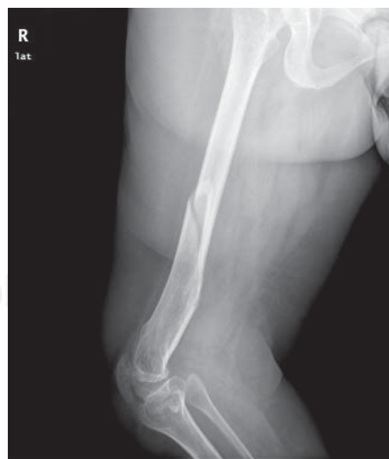
Figura 2. Proyección lateral del fémur con la deformidad asociada del extremo distal.