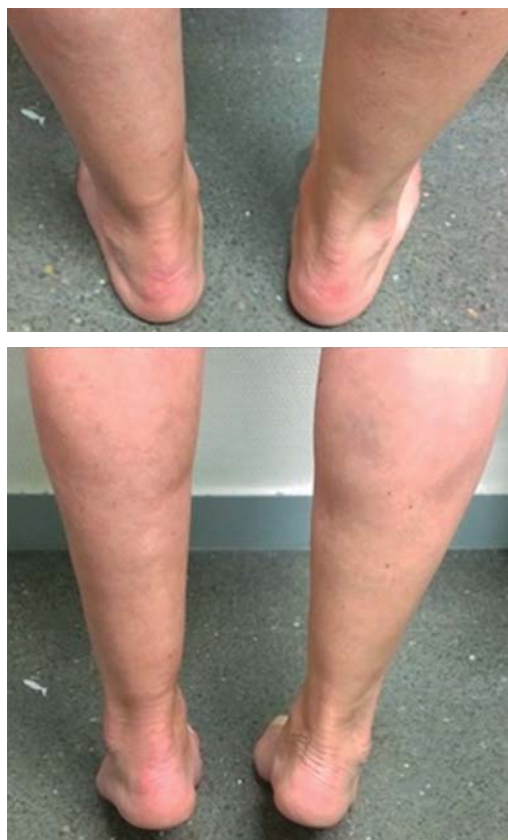
Figura 2. Fotos clínicas en bipedestación y de puntillas a los cinco meses de la lesión.

tiva evitaría las complicaciones relacionadas con la cirugía. De la misma manera, Costa y cols., 6 en 2006, en pacientes tratados de manera conservadora con carga temprana versus demorada, no encuentra diferencias entre ambas opciones.