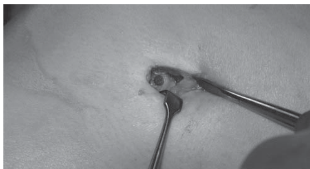
Figura 4. Imagen quirúrgica que muestra zona de fractura del pin bioabsorbible.

Dargel et al., 15 en dos grupos de estudio, compararon los resultados biomecánicos e histomorfológicos del uso de sistemas de pines transversos para fijación del LCA en el túnel femoral; en un grupo, el cabo femoral del injerto de isquio-