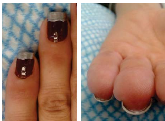
Figura 5. Un mes postoperatorio.

ner evidencia radiográfica de la consolidación. El paciente masculino reportó dolor de intensidad moderada del pulpejo por seis meses después del procedimiento. No hubo complicaciones en el resto de los pacientes. Una de las pacientes notó cambios en su huella digital porque el dispositivo de seguridad de reconocimiento de huella dactilar en su trabajo dejó de reconocerla y se ha mantenido así a un año del procedimiento.