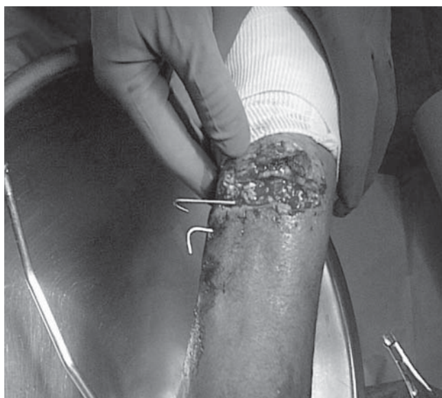
Figura 2. Imagen durante el primer procedimiento quirúrgico; nótese la importante lesión de tejidos blandos circundantes.

medición de túneles óseos y se impregnó el injerto en el plasma rico en plaquetas; se introdujo éste atravesando por ambos túneles de manera independiente; se utilizó el sistema de anclaje de sindesmosis para su fijación en posición neutra, se mantuvo un clavillo de Kirschner como fijación temporal. Se realizaron tenorrafias de tendones extensores de los dedos; por último, se corroboró la estabilidad mediante movimientos de pronosupinación y flexoextensión de la muñeca a partir de posición neutra, presentando un desplazamiento dorsal del cúbito remanente de 2 mm; se tomó control radiográfico, corroborando la dirección de los túneles y estabilidad del anclaje (Figura 4). Se regularizaron bordes cutáneos y se afrontaron tejidos por planos, terminando el procedimiento quirúrgico en dos horas y 30 minutos. Se colocó vendaje algodonoso y férula braquipalmar en posición neutra.