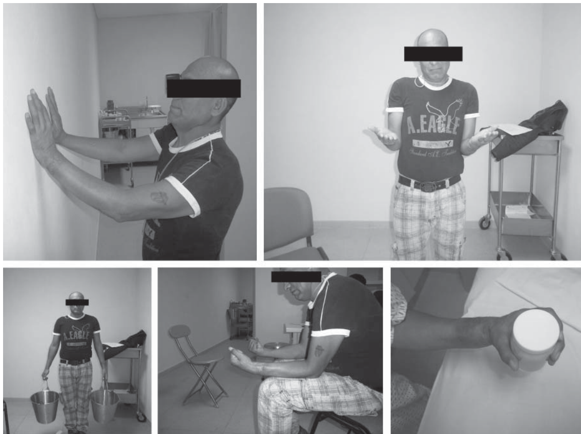
Figura 5. Capacidad funcional a los siete meses de postoperatorio.

Imagen radiográfica de la fijación final, obteniéndose una buena reducción de la luxación.