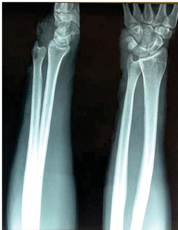
Figura 1. Proyecciones radiográficas anteroposterior y lateral del antebrazo izquierdo, donde se observa desplazamiento del cúbito hacia dorsal.

de Kirschner de 1.65 mm; se tomó injerto de tendón del gracilis con técnica convencional. Se colocó el antebrazo en posición neutra y se realizó perforación con una broca de 3.7 mm a 1.5 cm de la apófisis estiloides del cúbito y con una orientación trasversal, se realizó una segunda perforación a 2 cm proximales a la primera, en una dirección nuevamente de cubital a radial e inclinación de dorsal a volar de 35° y angulación proximal de 15° (Figura 3). Se realizó