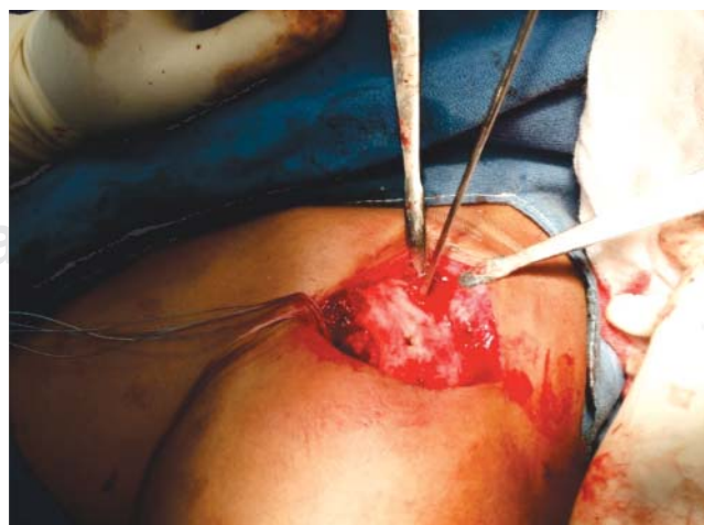
Figura 2. Se realizan las perforaciones en la clavícula.