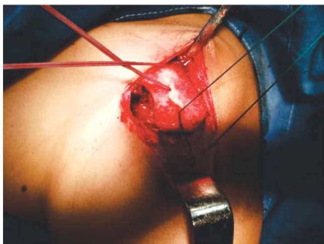
Figura 3. Se recuperan las suturas por las perforaciones.