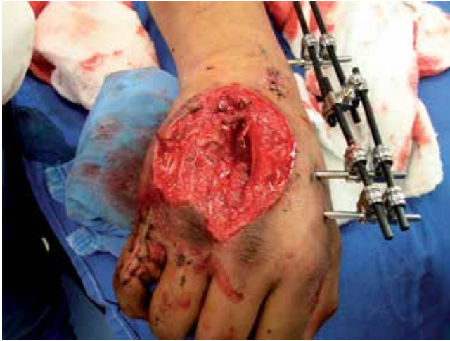
Figura 3. Se realizaron desbridamientos en tres ocasiones.