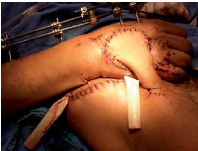
Figura 5. Rotación de colgajo fasciocutáneo de ingle a mano derecha.

de MHISS 198 Swanson tipo II, Hannover 15 ( Figura 1 ). 16,17,18,19