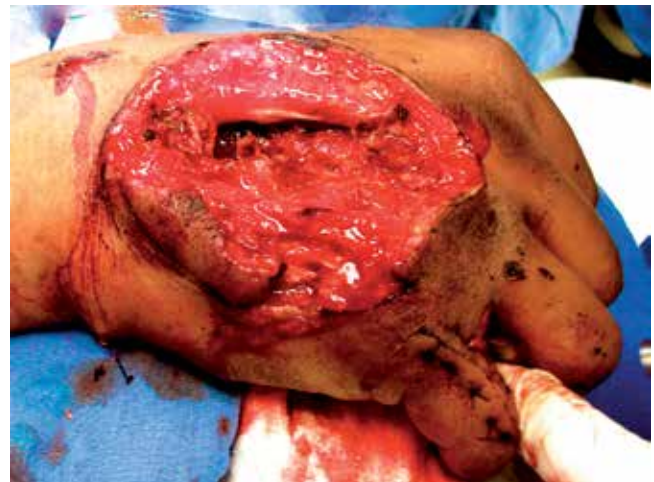
Figura 1. Fotografía de ingreso donde se observa lesión severa de partes blandas.

en la mano derecha, cuyo orificio de entrada fue por el dorso a nivel del metacarpo con pérdida cutánea, exposición ósea y tendinosa. El orificio de salida fue hacia la región volar de la muñeca con disminución de pulso cubital y anestesia de región cubital. La movilidad no pudo ser valorable a su ingreso, obteniéndose un score