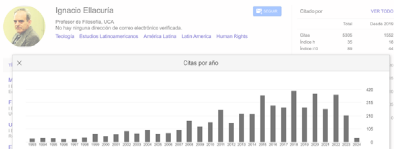
FIGURA 1. MUESTRA LA EVOLUCIÓN DE LA RECEPCIÓN DE LA OBRA DE IGNACIO ELLACURÍA SEGÚN LOS DATOS BIBLIOMÉTRICOS DE GOOGLE SCHOLAR.

La nueva edición que plantea el proyecto Ellacuría: Obras completas nace en la órbita de todas estas iniciativas con el propósito de continuar difundiendo el pensamiento de Ignacio Ellacuría ante el creciente interés que en los últimos años ha despertado la teología de la liberación y especialmente la obra de Ignacio Ellacuría entre algunos de los principales representantes del pensamiento crítico en América Latina: Raúl Fornet-Betancourt (1994, 2010, 2016), Nelson Maldonado-Torres (2007), Enrique Dussel (2008), Boaventura da Sousa Santos (2014), o Franz Hinkelammert (2020, 2021) [Ver figura 1].