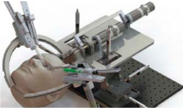
Figura 2: Mechatronics® en su dispositivo de precisión de cirugía robótica para oftalmología. 40

bajo simulaciones de escenarios críticos, permite desarrollar mejores herramientas de precisión para ejecutar posteriormente en un escenario real, consiguiendo así una curva de aprendizaje más amplia y en menor tiempo. 41-43